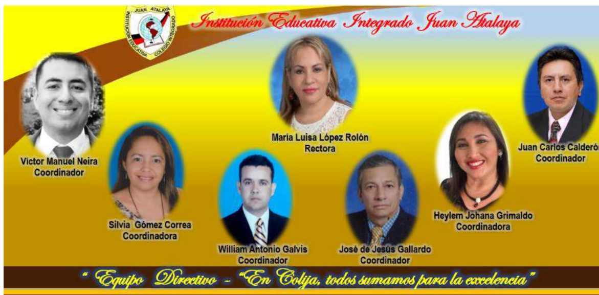
Equipo Directivo Colija