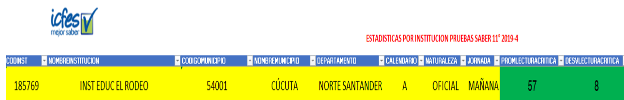
Figura 1 Resultados Pruebas ICFES 2019-4