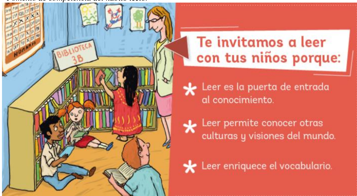
Figura 5 “Fomento de competencia del hábito lector”