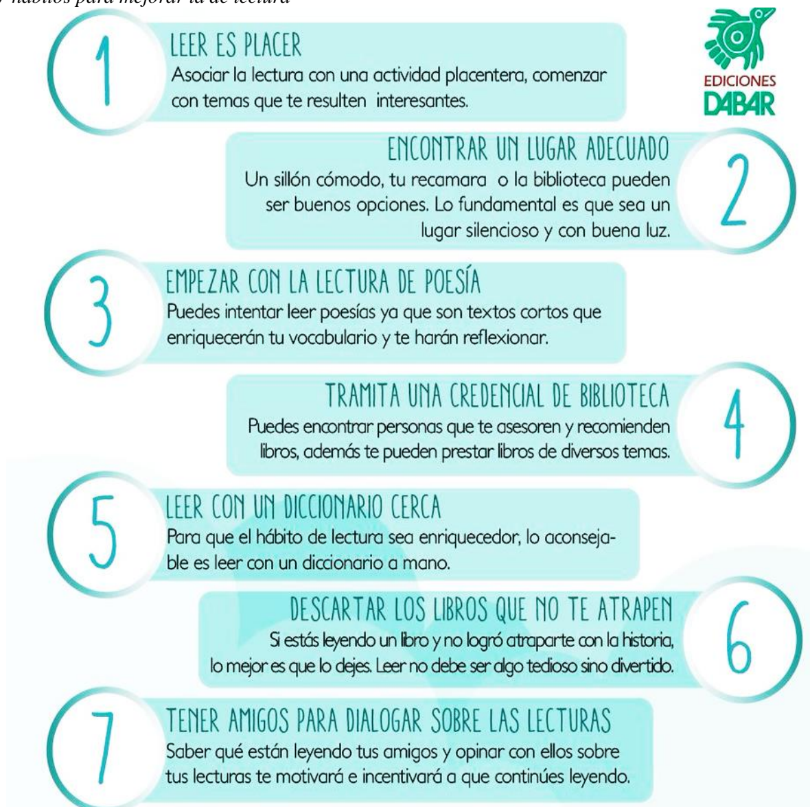
Figura 6 “7 hábitos para mejorar la de lectura”