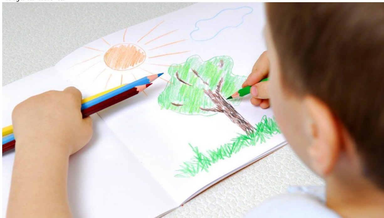
Figura 9 Dibuja la historia