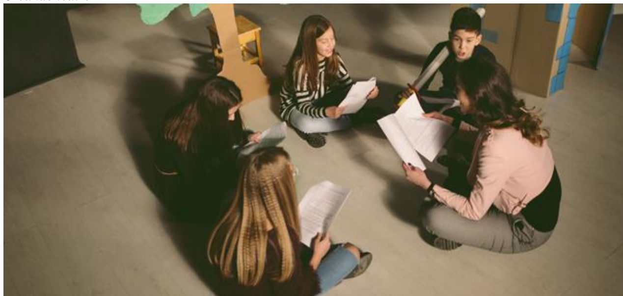
Figura 10 Creando teatro