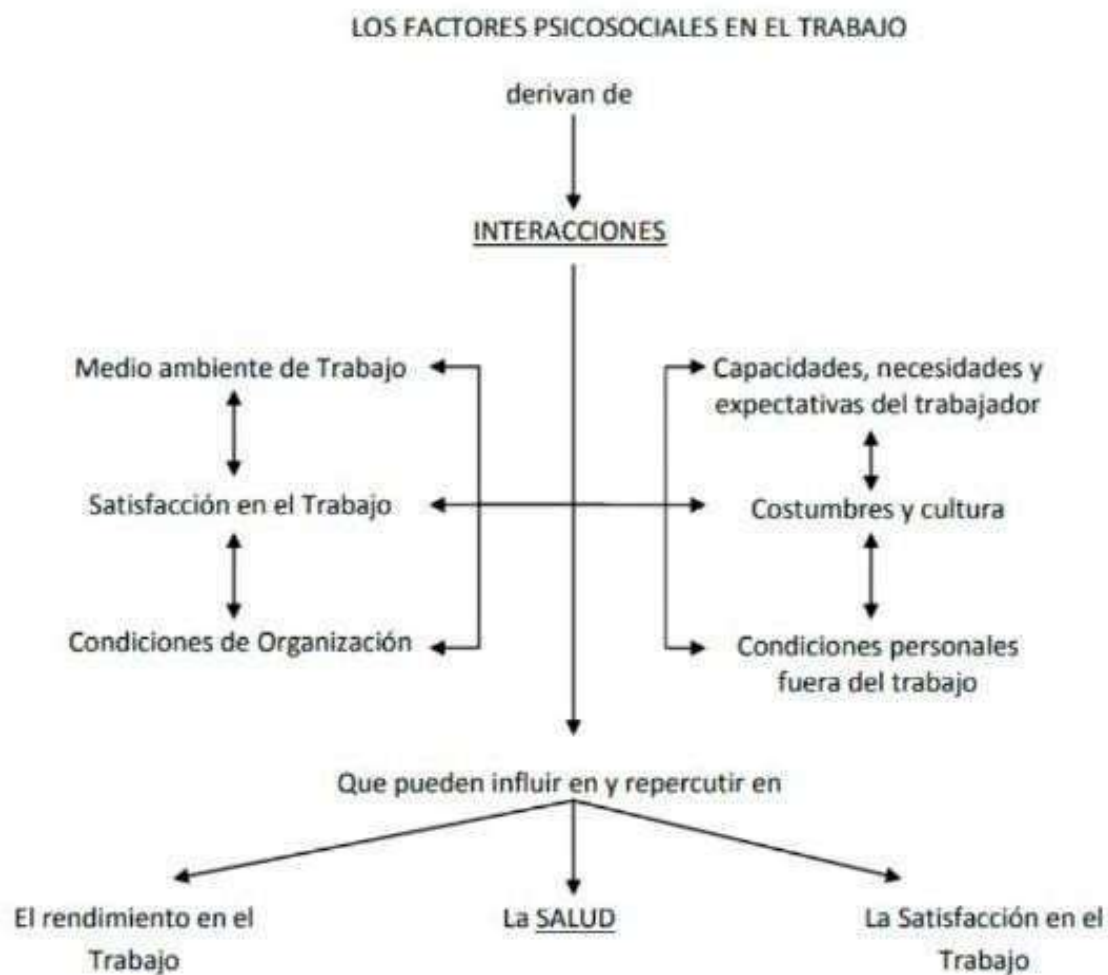
Figura 2. Factores de riesgo psicosocial.

macrosistema es la estructura ecológica más externa del individuo, influyendo principalmente por su capacidad para determinar qué relaciones entre las distintas estructuras se producirán en un momento histórico determinado. Es decir, que el macrosistema hace referencia o se constituye de ideologías y sistemas de creencias de la sociedad en donde el individuo se desenvuelve, pudiendo incluir el orden jurídico, los valores y tradiciones, la influencia de la religión, las políticas sociales, entre otros.