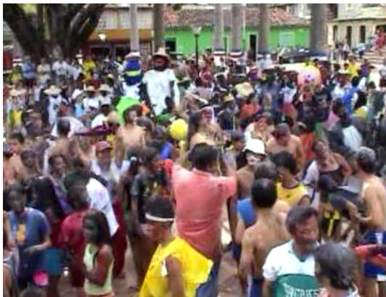
Celebración 24 de Diciembre reunión de las 9 comparsas, espera El dictamen de los tres primeros lugares