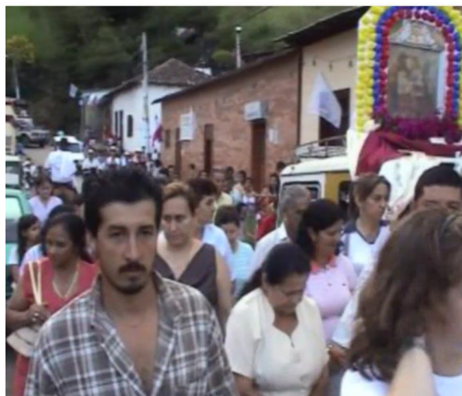
Procesión Virgen de Monguí, entrada al Municipio