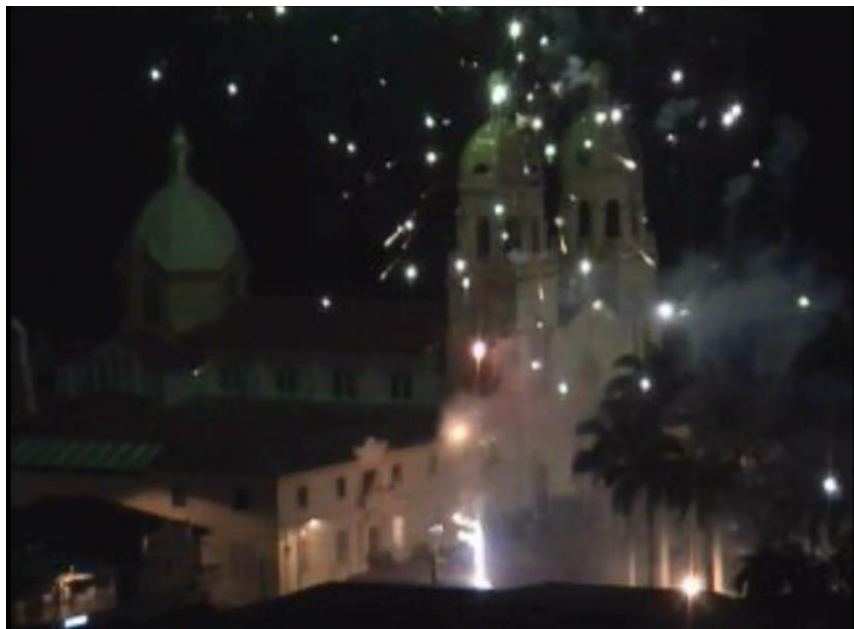
Cumpleaños 1857-2007 del municipio de Gramalote, fuegos artificiales