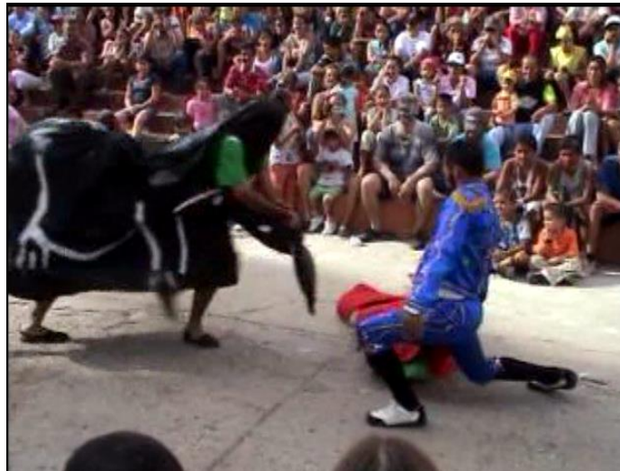
Presentación el matador y el toro Comparsa Barrio Santa Rosa año 2007 (gremio de peseros)