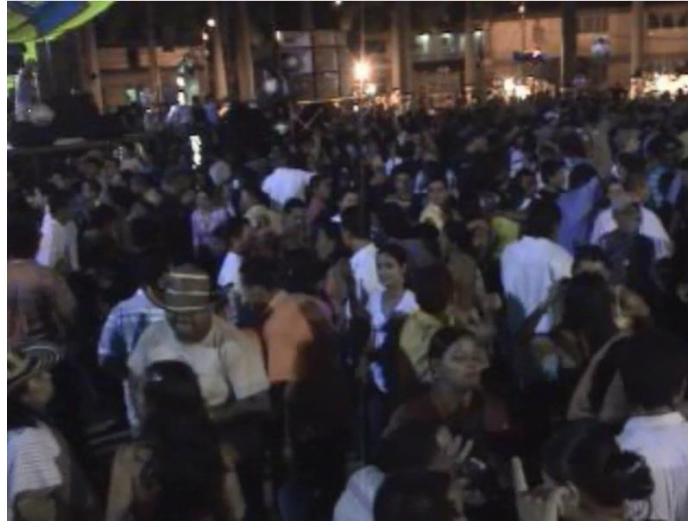
Baile popular fin de año, plaza parque principal 31 de diciembre año 2007