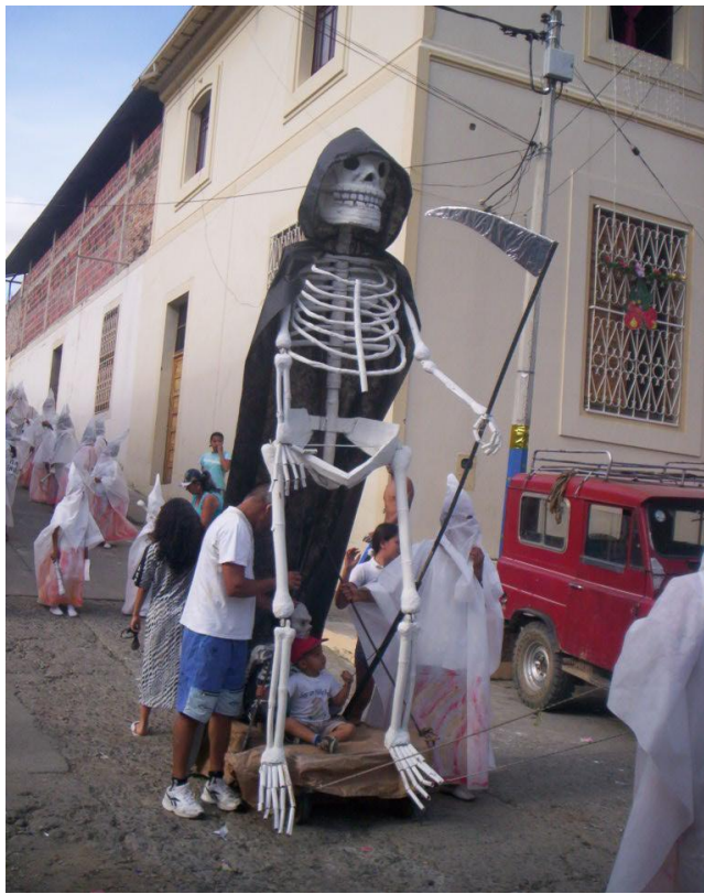
Barrios Unidos presentación Comparsa Año 2008