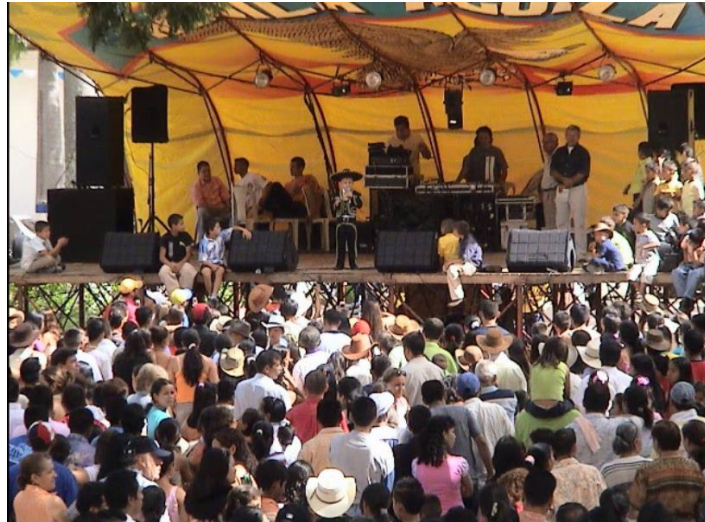
Baile popular, presentaciones, grupos musicales invitados 6 de reyes 11 enero 2009