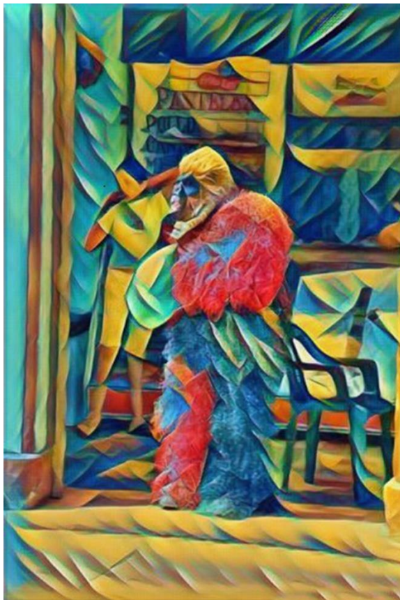
Disfraz típico: “Diablo”

[Fotografía editada en la plataforma enjoy photo-atwork]