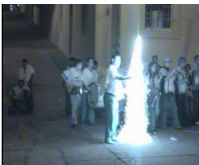
Alborada Musical, papayera Municipal 3:00am recorrido preliminar a las Misas de Aguinaldo