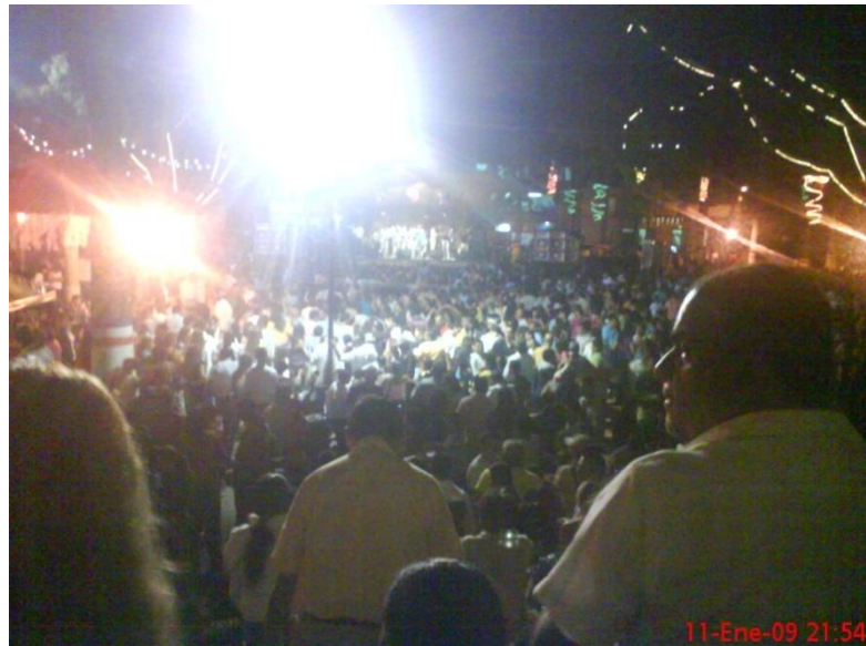
Baile popular, presentaciones, grupos musicales invitados 6 de reyes 11 enero 2009