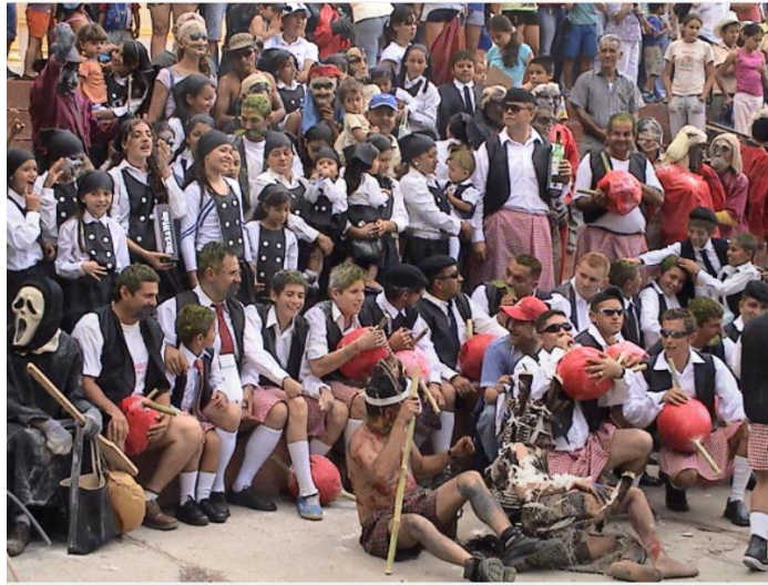
Barrio la Lomita comparsa Motivo los escoceses año 2007