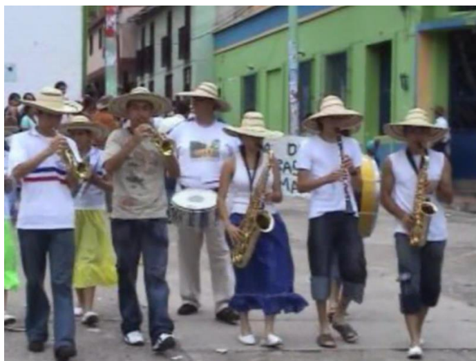
Papayera Municipal acompañando la comparsa de turno.