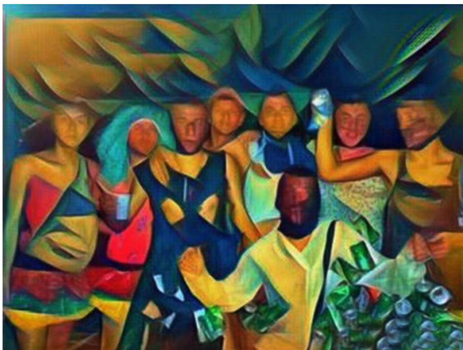
Disfrazados- día de los locos

[Fotografía editada en la plataforma enjoy photo-atwork]