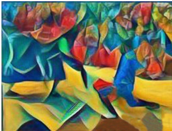
El matador y el toro

Estaba comprendida por la temática elegida por la organización del barrio, los disfrazados; representados con trajes coloridos y máscaras, carrosas y grandes artilugios en movimiento que animaban la comparsa; además de los típicos “diablos”, brujas y monstruos que perseguían o “correteaban” a los que participaban de esta actividad un factor fundamental de esta celebración. La papayera municipal amenizaba el baile y la marcha de la comparsa por todo su recorrido, la harina, la pintura, la pólvora, la música, el arte, la danza, el aguardiente y el guarapo eran elementos propios del festejo.