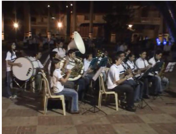
Música Banda Sinfónica Reloj Lunar