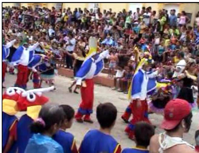
Comparsa Santa Rosa año 2007 – Motivo carnaval de Barranquilla (Presentación Baile)