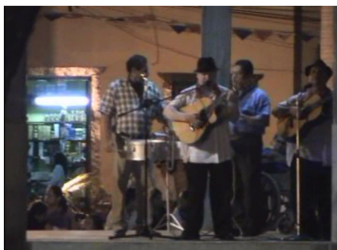
Presentaciones grupos musicales