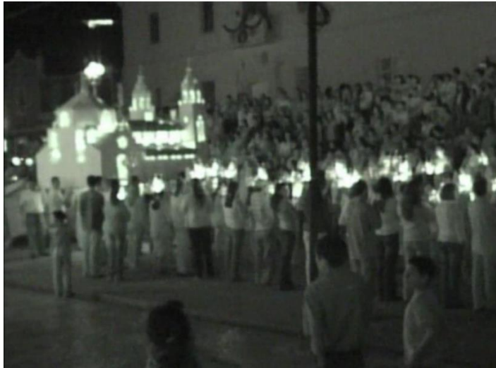
Concurso de Faroles, procesión; punto de llegada Atrio iglesia San Rafael