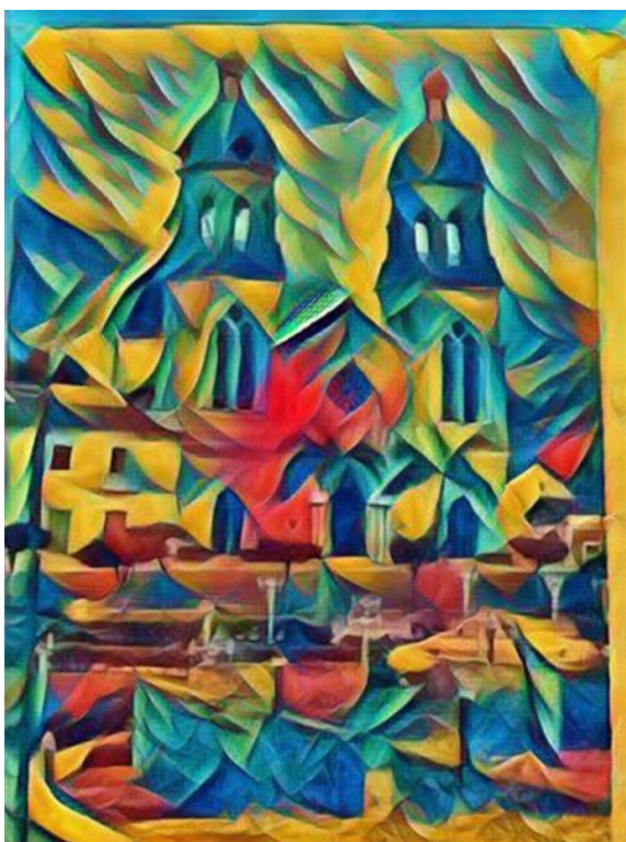
Iglesia San Rafael de Gramalote

Un aspecto muy importante de las comparsas es el repique de las campanas a las 12: 00 del medio día como un signo de vísperas de la novena del día siguiente; las campanas que marcaban la alegría, el son del municipio de Gramalote las encargadas de anunciar las festividades navideñas.