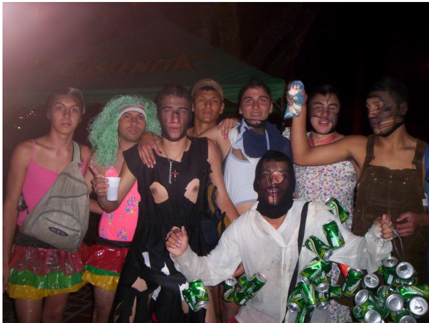
Celebración parte de disfrazados; "locos", noche Año 2007