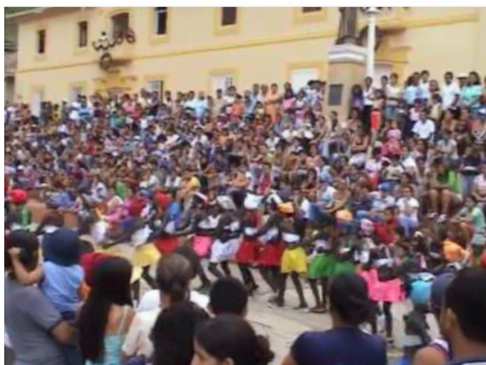
Presentación baile Las palanqueras Comparsa año 2007