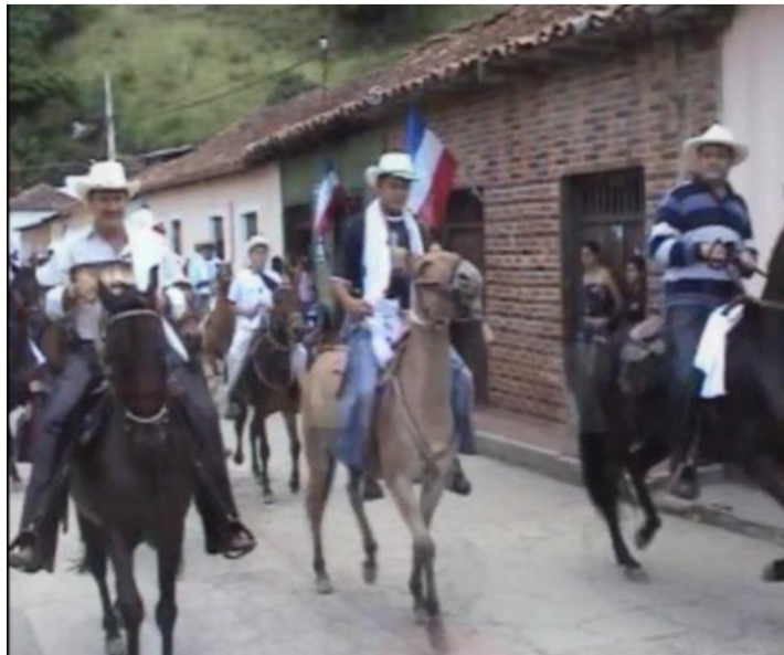
Cabalgata en honor a la virgen de Monguí patrona del municipio, Llegada de la imagen al pueblo.