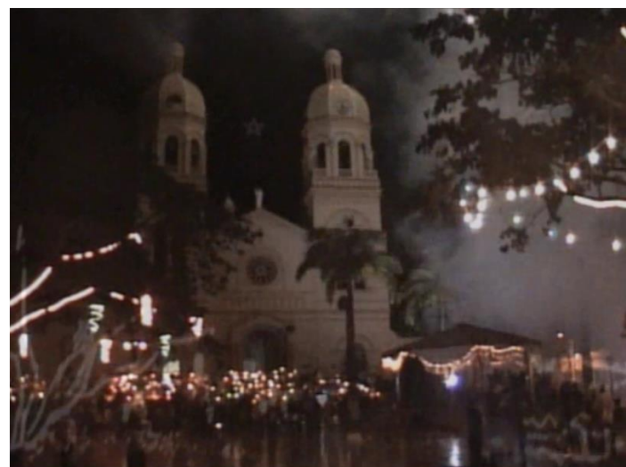
Concurso de Faroles, procesión; punto de llegada Atrio iglesia San Rafael