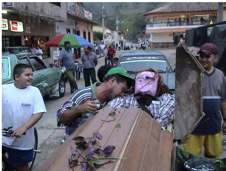
Despedida de años viejos 31 de diciembre año 2004