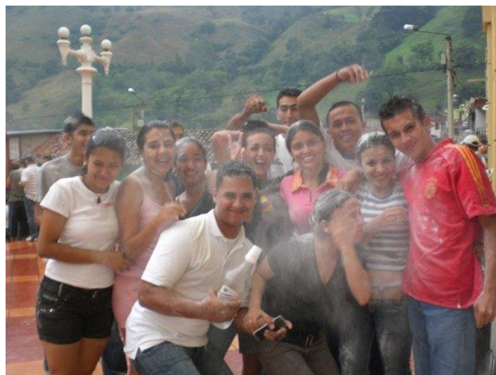
Reunión de bachilleres-promociones Atrio de la iglesia San Rafael celebración tradicional