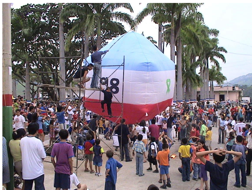
Elevación de Globos año 2007, parque principal Promoción de bachilleres del 1998