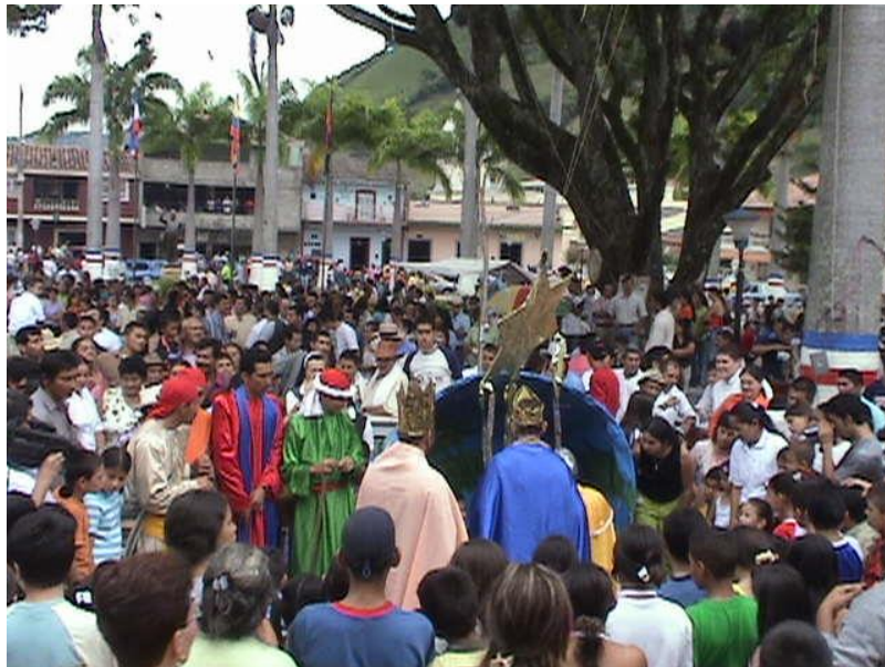
Epifanía del Señor, representación en vivo plaza de la restauración Año 2008