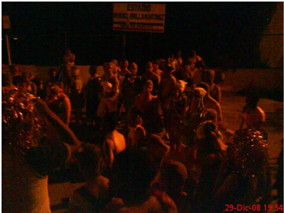
Punto de partida recorrido de los locos (Estadio Manuel Grillo Martínez) 29 de Diciembre de 2008