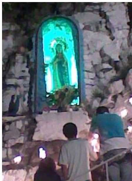
Ofrenda Virgen de Lourdes, 7 de diciembre 2008 (Velas blancas ofrenda)