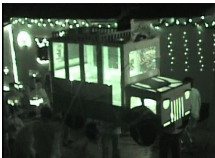
Concurso de Faroles, procesión; punto de llegada Atrio iglesia San Rafael