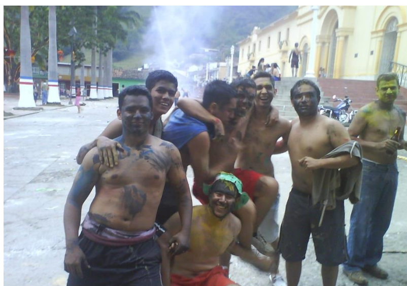
24 de Diciembre Año 2008- grupo de amigos celebración tradicional