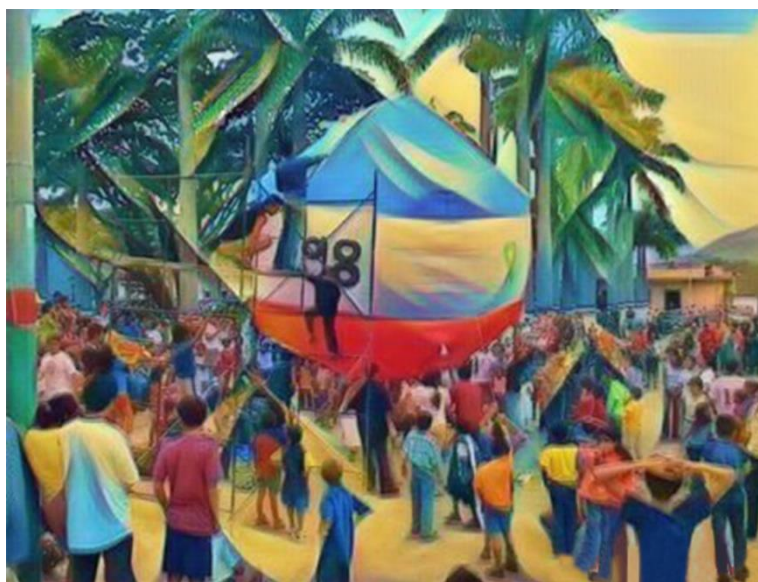
Elevación de globos-parque principal

[Fotografía editada en la plataforma enjoy photo-atwork]