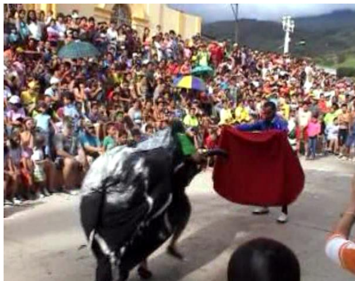
Presentación el matador y el toro Comparsa Barrio Santa Rosa año 2007 (gremio de peseros)