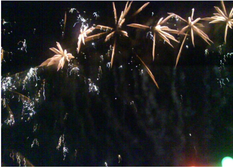
Celebración noche buena 12:00 am-fuegos Artificiales