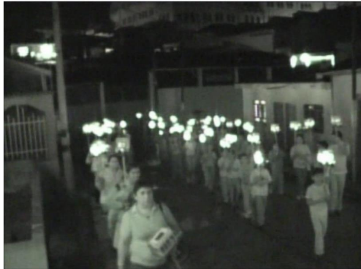
Concurso de Faroles, procesión; punto de llegada Atrio iglesia San Rafael