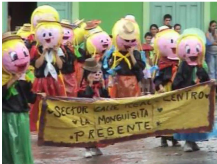
Sector Calle Real –Centro, vereda la Monguisita Comparsa 2007