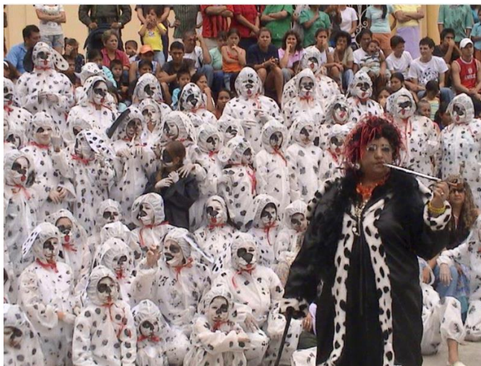
Comparsa calle real-centro interpretación 101 dálmatas Año 2008