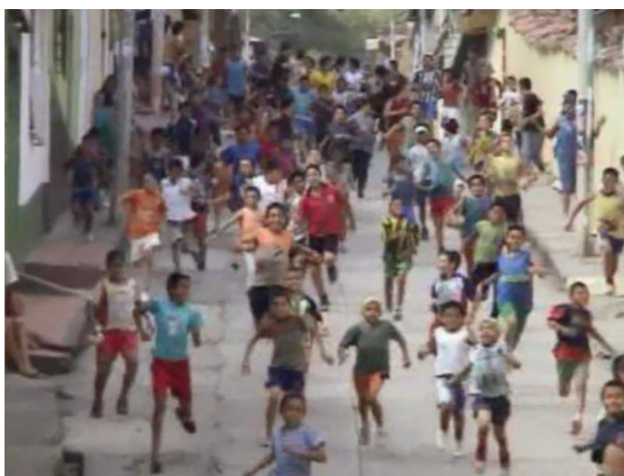
Niños, jóvenes y adultos corriendo, perseguidos por los "diablos".