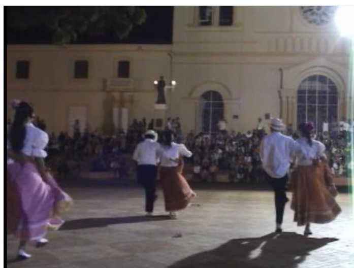
Actos culturales noches de novena de Aguinaldos