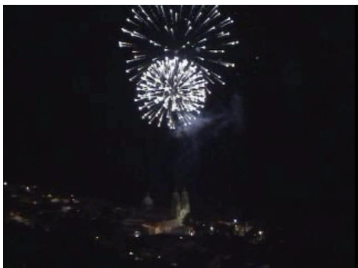
27 de Noviembre juegos artificiales, celebración 150 años del Municipio de Gramalote.