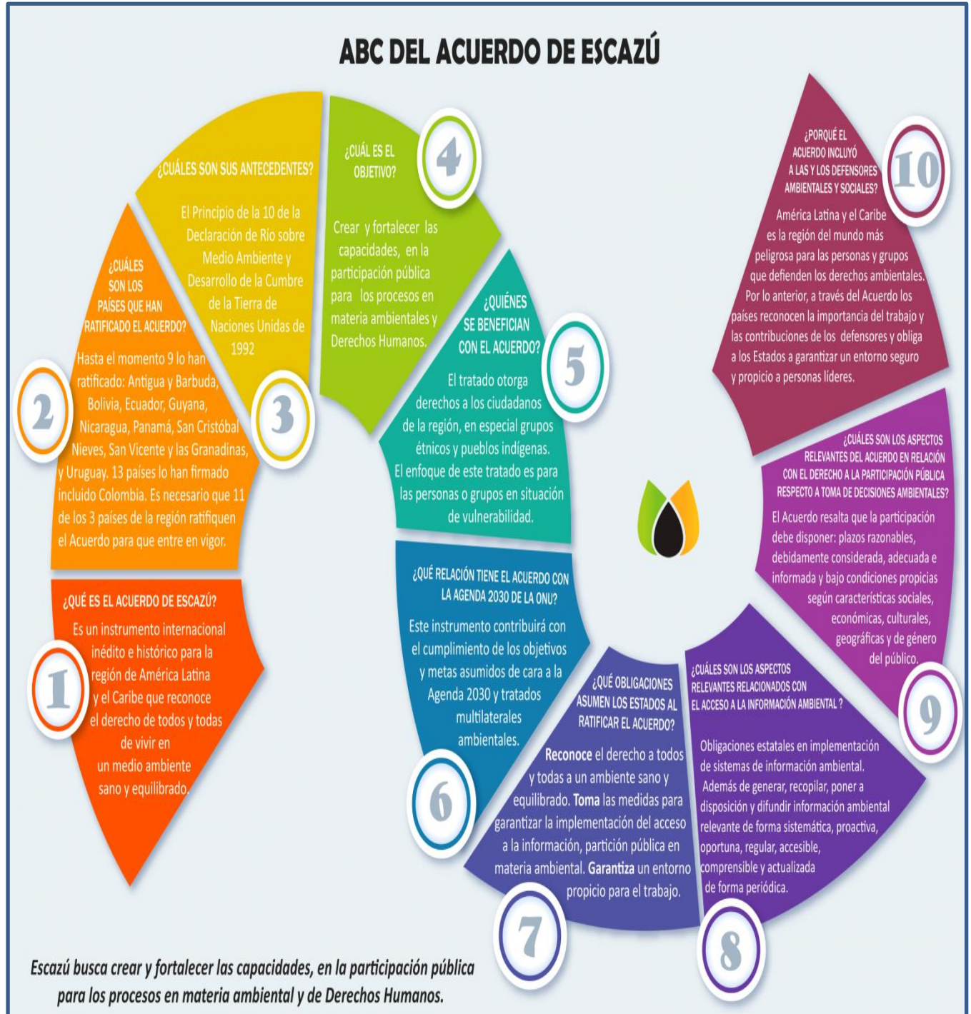
Figura 2 Objetivos Acuerdo Escazú