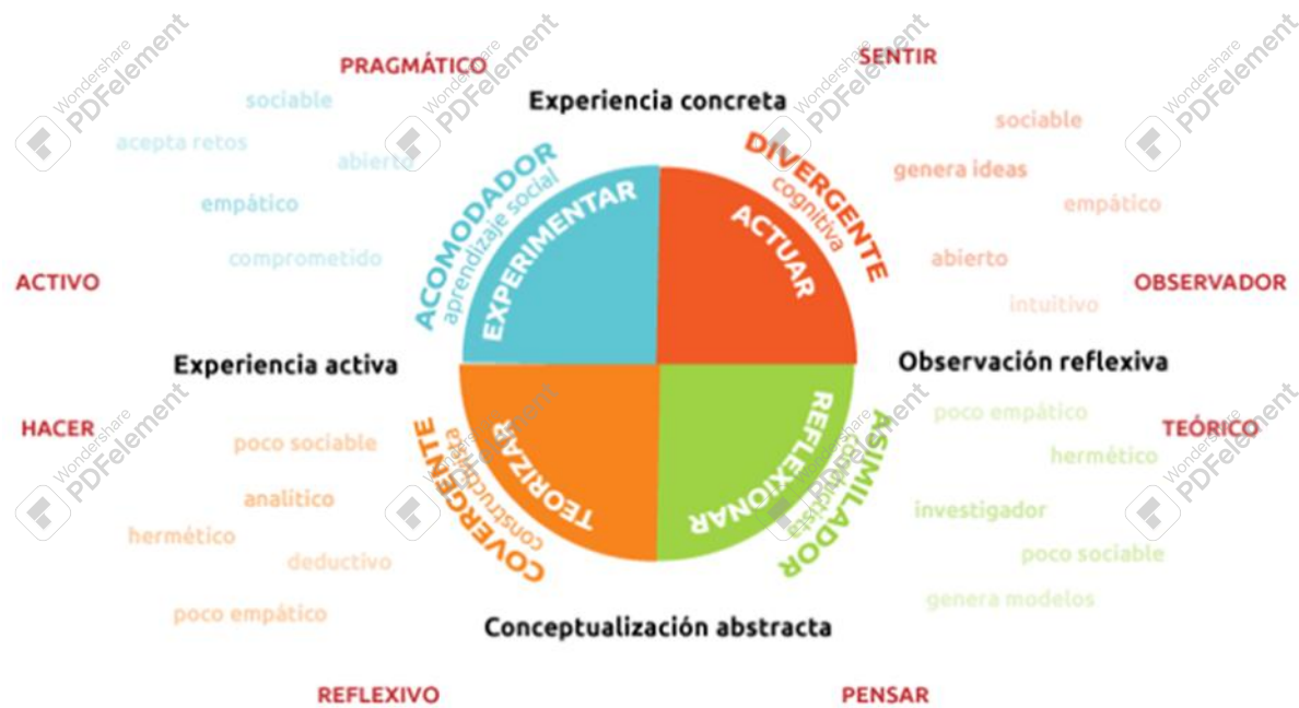
Ilustración 2 cuatro estilos de aprendizaje según Kolb (1984) https://www.actualidadenpsicologia.com/la-teoria-de-los-estilos-de-aprendizaje-de-kolb/

Según el autor para que el aprendizaje sea óptimo se deben tener en cuenta cuatro fases adicionales las cuales son: la experiencia concreta la cual da pie a la observación, la observación reflexiva en donde se realiza una observación y de allí sale un análisis o hipótesis sobre la información que se recibe, la conceptualización abstracta que se refleja a raíz de la hipótesis y de allí se forman los conceptos abstractos y por último la experiencia activa que se da cuando la persona experimenta o practica los conceptos que aprendió en otros contextos o situaciones.