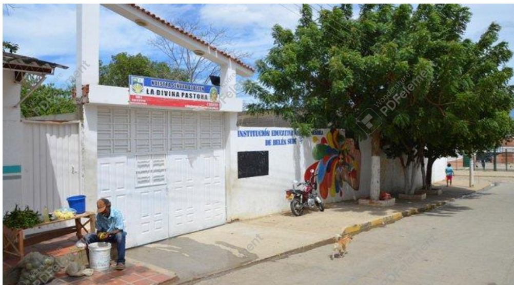
Ilustración 4 institución educativa Colegio Nuestra Señora de Belén Sede 4 La Divina Pastora