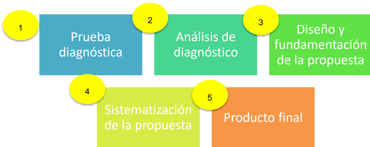
Ilustración 1: Fases de la investigación

Luego de realizado el debate, como resultado del proceso de aplicación del modelo Toulmin, se procede a hacer una evaluación de los resultados obtenidos con la aplicación de la propuesta y finalmente, se realiza un diagnóstico final, donde se corrobore si realmente se fortaleció el eje.