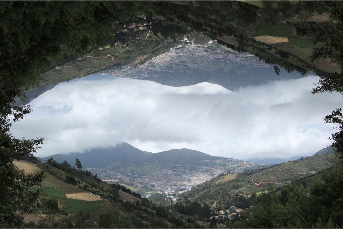
Ilustración 7 Abriendo portales (Higuera,2017)