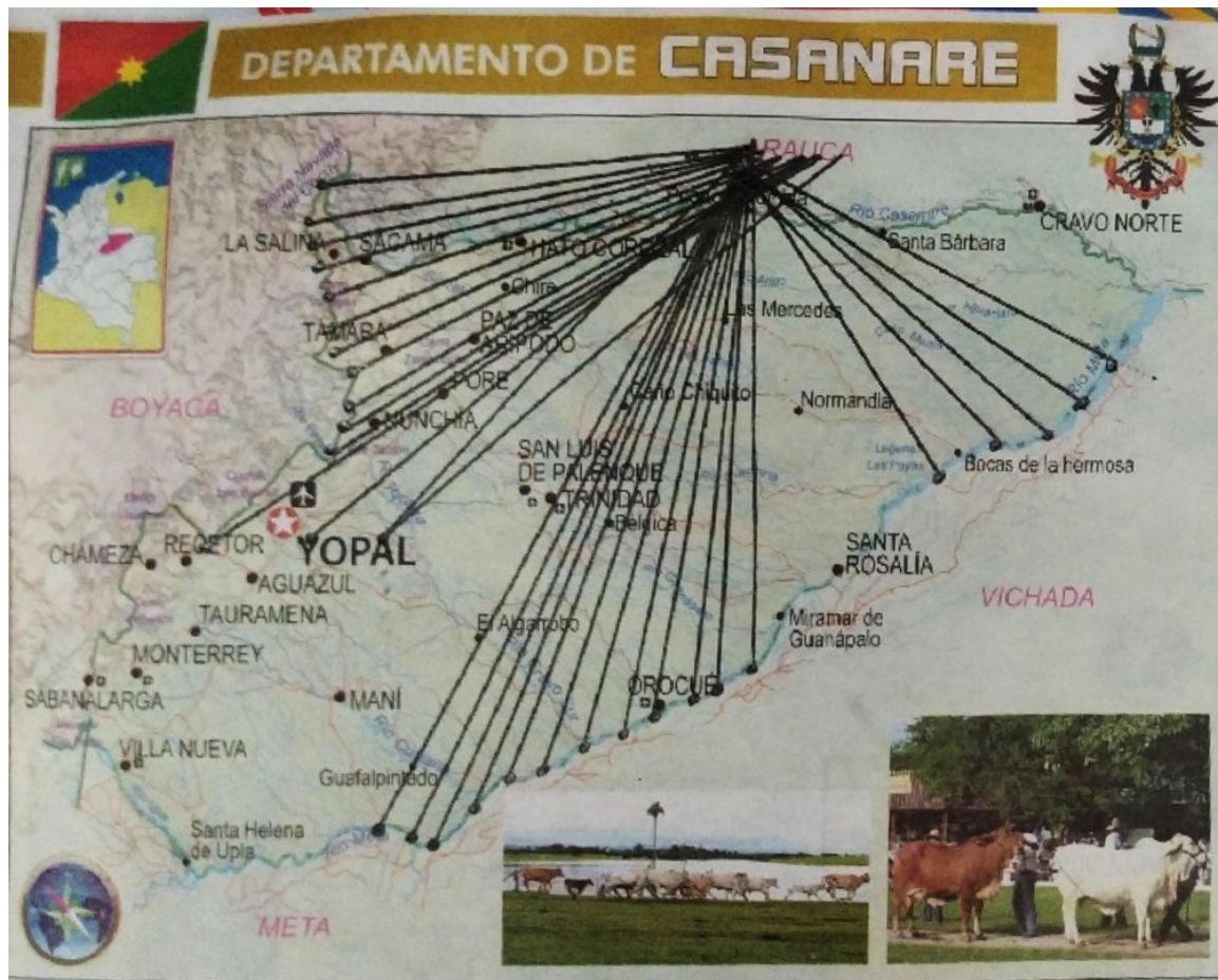
Ilustración 14 Cartografía del Casanare (Gelvez, 2020)

En la cartografía siguiente se toma de Colombia, es importante resaltar los territorios que comparten costumbres y paisajes llaneros, pero que pertenecen en este caso a Colombia, los territorios llaneros se ubican en un rincón, pero eso me permitió reunirlos dibujando sobre ellos un arpa.