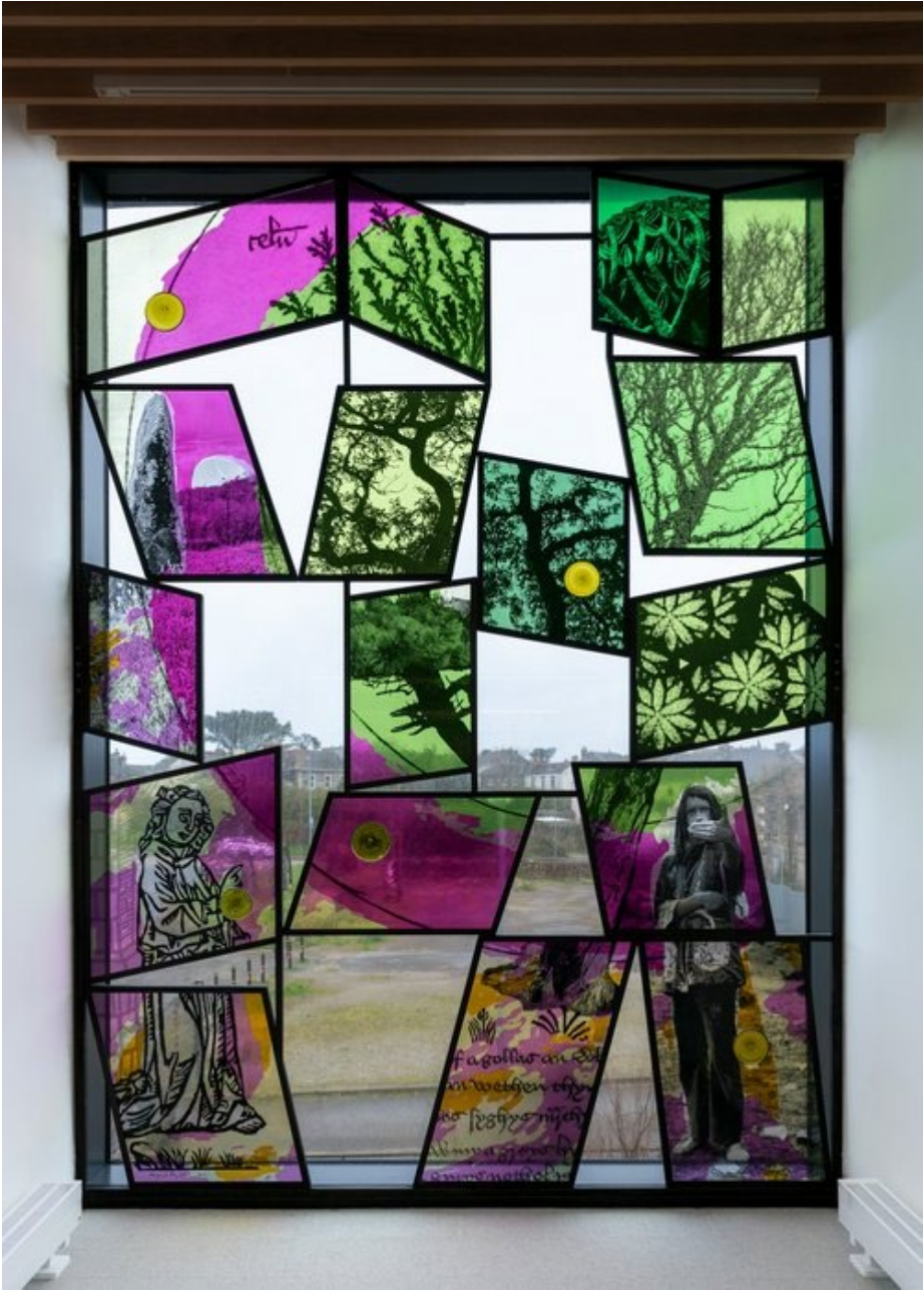
Ilustración 2 Tre, 2022 (Cooney,2022)