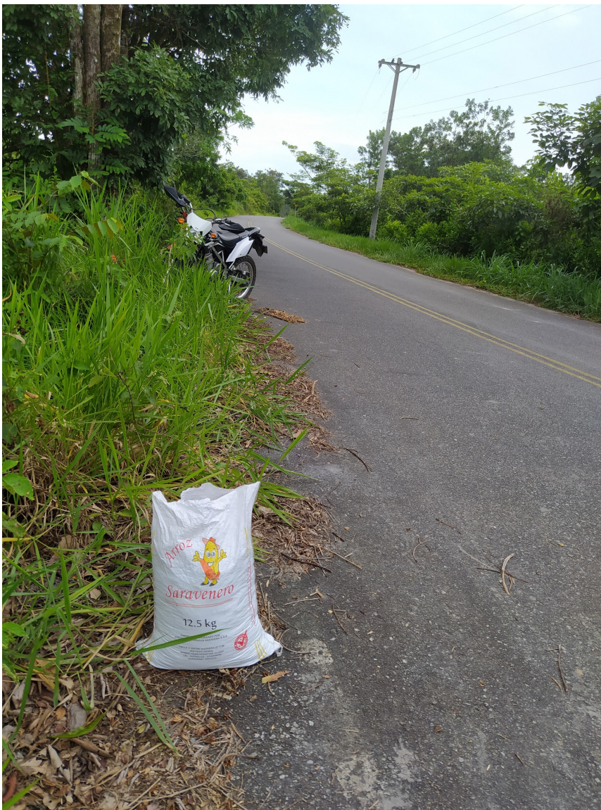
Ilustración 24 Traslado del elemento tierra. (Gelvez,2022)

Al momento de la excavación procedo a trasladarme con el elemento y me dispongo a viajar, este viaje se torna interesante porque sale un dilema en el que hace del recuerdo de los colonos se manifieste, pues la mayor parte de la población desde los colonos hicieron ese mismo recorrido en busca de esas maravillosas tierras y traerla a los Santanderes se vuelve una forma de darle a conocer a ese elemento lugares de donde provienen todas esas personas que lo aprecian.