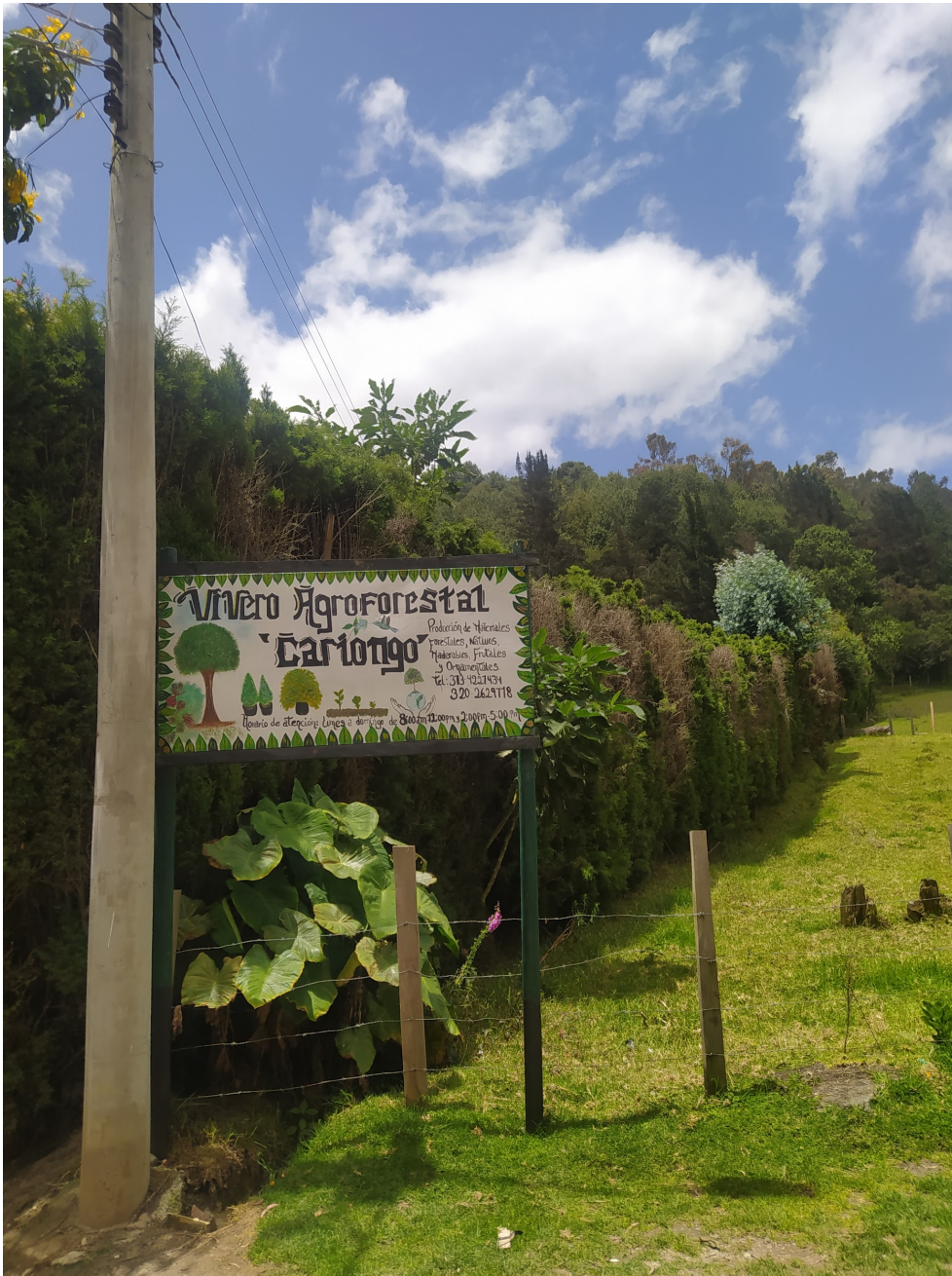
Figura 28- Lugar de Exposición (Gelvez, 2022)