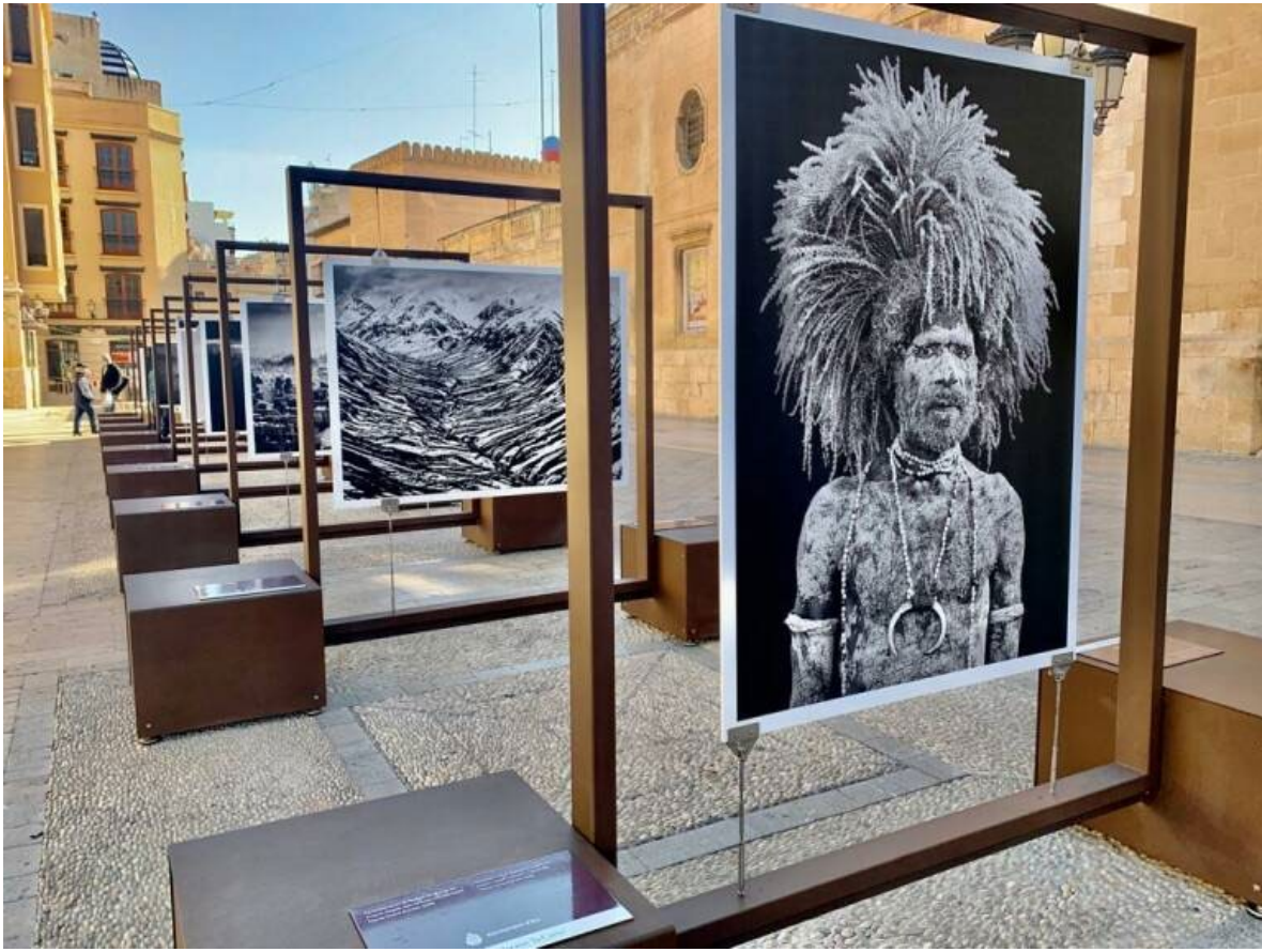
Ilustración 12 Museo al aire libre en la plaza del congreso eucarístico con fotos de Sebastião Salgado exposición de Génesis.

Génesis como es llamada la anterior obra, me interesa rescatar de Salgado el motivo de exposición al aire libre y su tratamiento en la imagen, que también tiene una mirada al paisaje natural, cosa que también quiero capturar desde la fotografía digital.