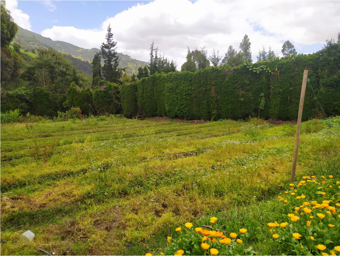
Figura 29- Sitio donde se encontrarán las fotografías expuestas(Gelvez, 2022)