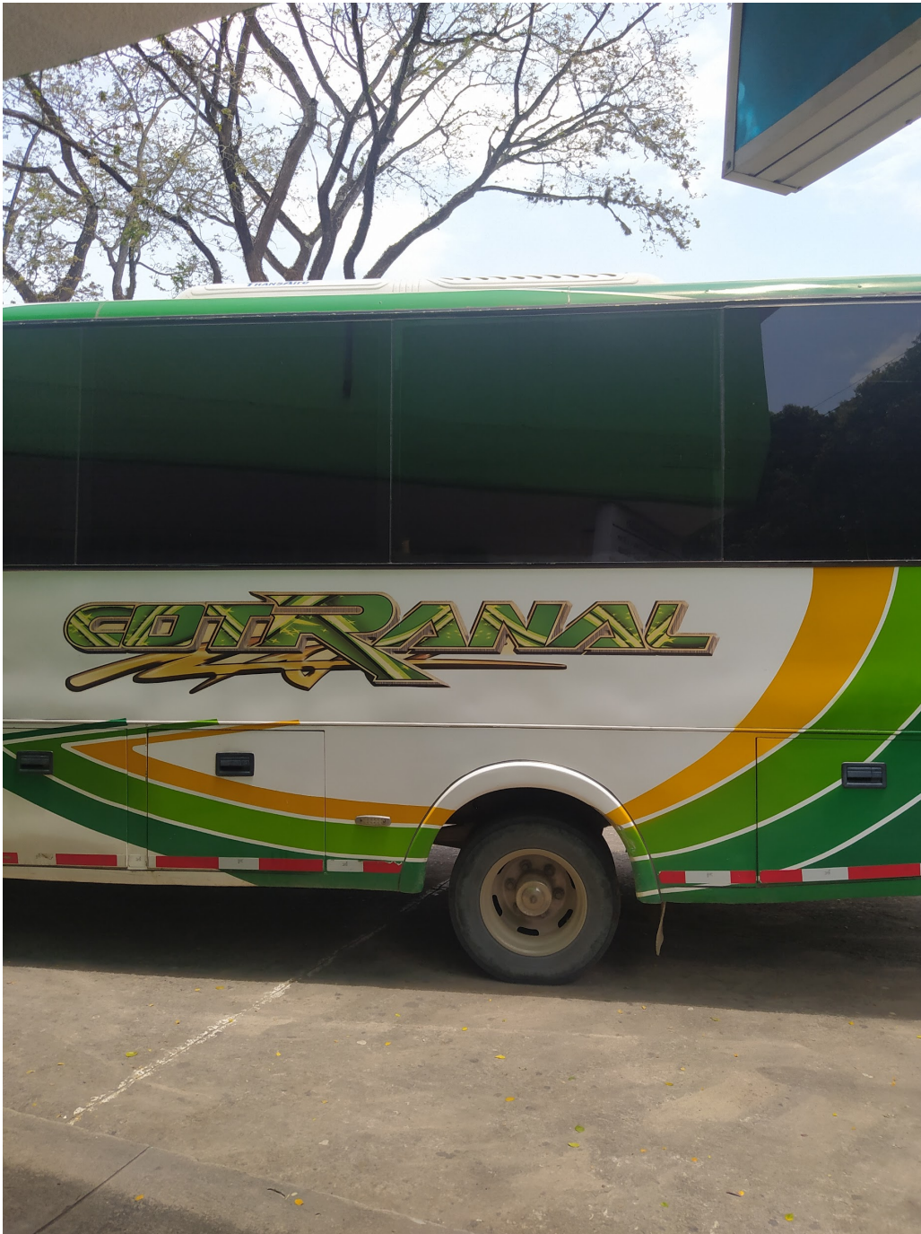
Ilustración 26 transporte Cotranal (Gelvez, 2022)

Dentro del viaje me enfrento a situaciones comunes que se presentan en la vía de la soberanía que desde relatos la vía ha permanecido en el mismo estado, pero al momento de lograr el transbordo me pasan cosas curiosas porque les genera intriga a los campesinos de