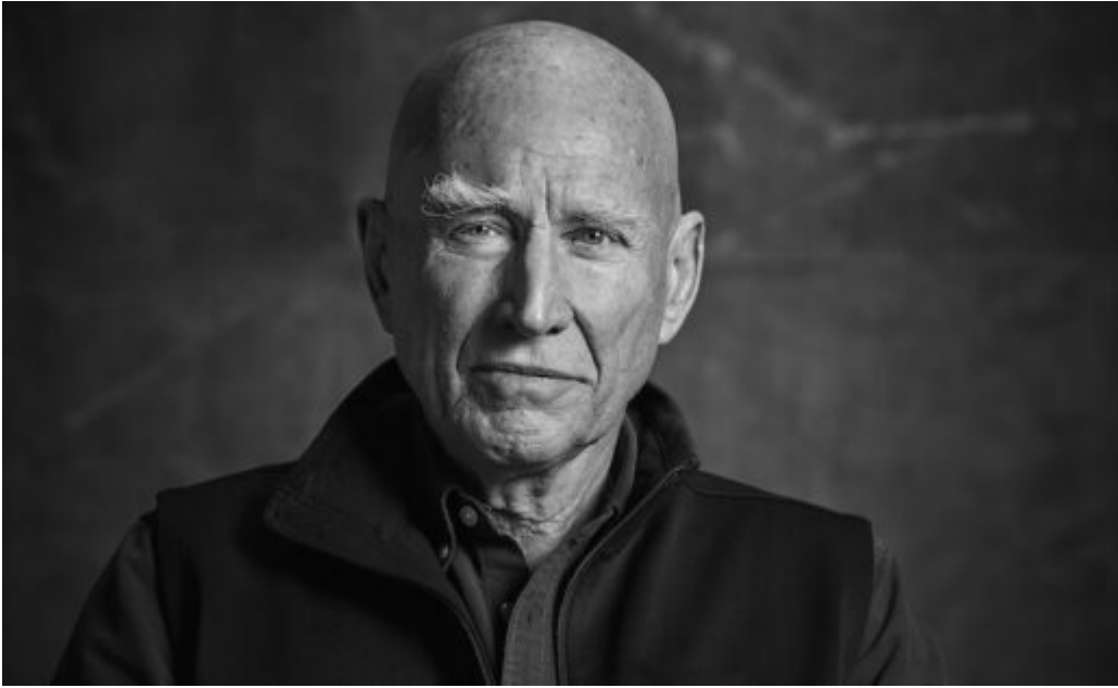
Ilustración 11- Autorretrato de Sebastião Salgado

Salgado es un fotógrafo nacido en el 1944 en Aimorés, Minas Gerais, Brasil, su trabajo se realiza en torno a capturar con su cámara situaciones de personas que residen en países subdesarrollados, además, retrata el paisaje mostrando lo que se debe proteger como animales y ecosistemas como muy coloquialmente se menciona Salgado retrata la cruda realidad, el artista ha tenido la oportunidad de viajar por el mundo y esto le ha permitido desarrollarse dentro de la fotografía documental.