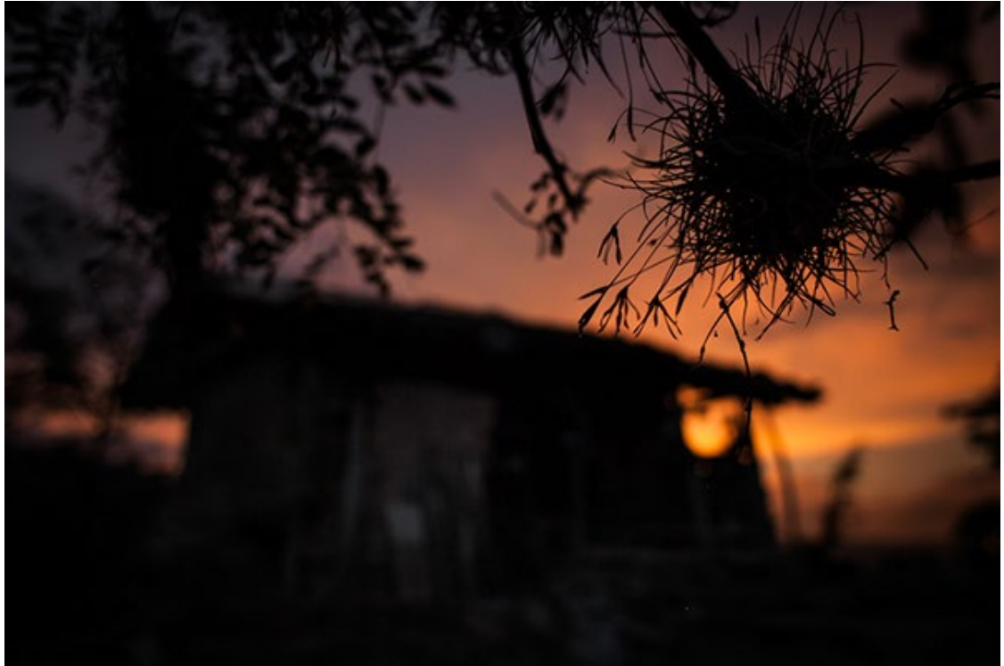
Ilustración 5 De Boyacá en los campos (Rodríguez, 2014)