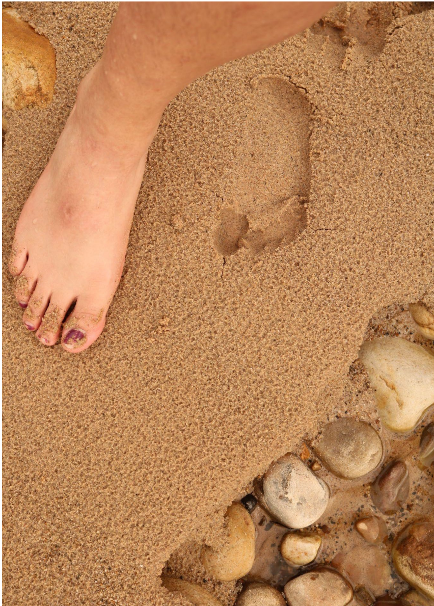
Ilustración 18 Inspiración para realizar la obra (Gelvez,2020)

que toca el agua del río es al que le pides permiso para continuar, para acceder, para continuar con la exploración, cuentas con los pies para seguir el camino que le pides que te sostenga, es necesario admirar ese movimiento de los pies y que nos permite mantenernos parados.