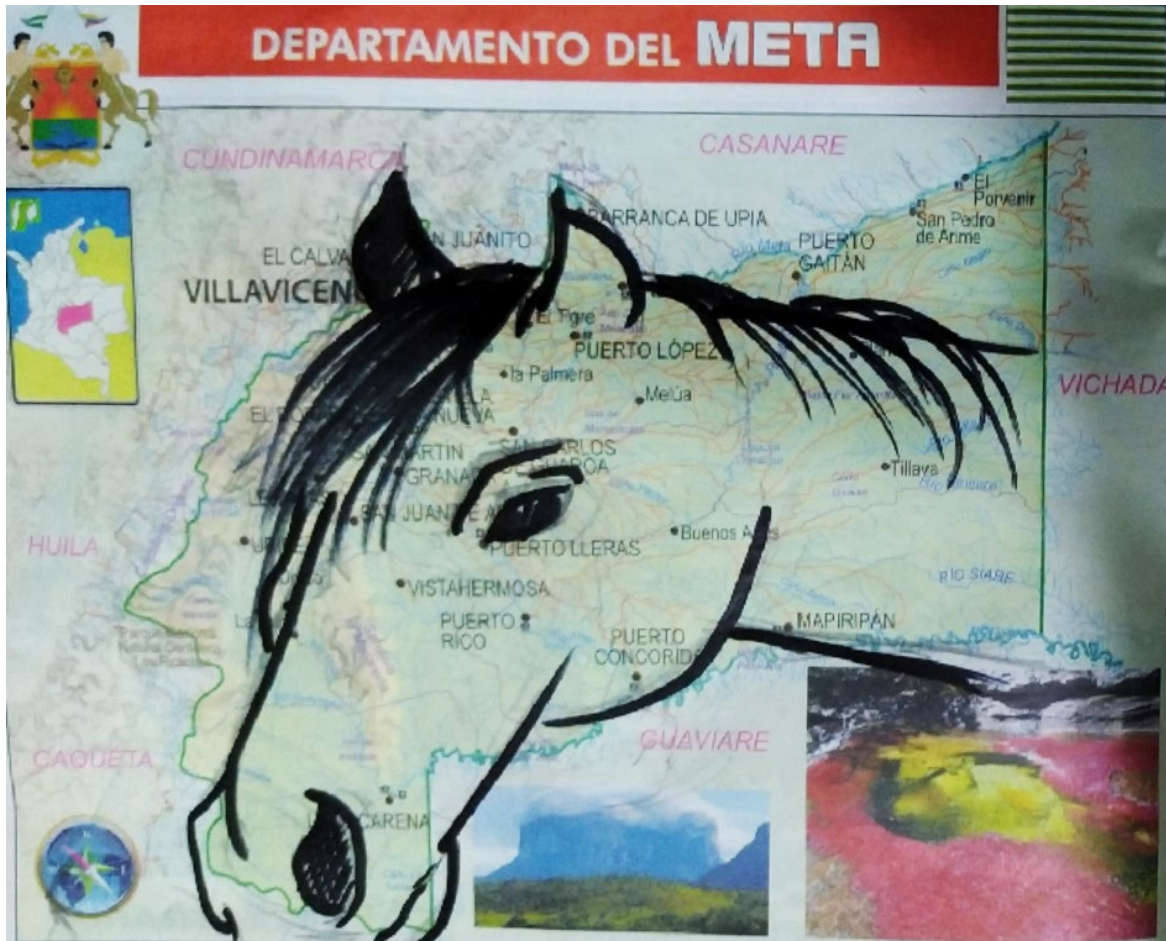
Ilustración 16 Cartografía del meta (Gelvez,2020)

llevar prácticas de carga, para el coleo y para ser expuesto como animales imponentes y que cuentan con una belleza admirable.