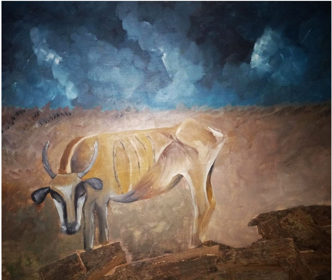
Ilustración 17 La soledad del toro (Gelvez,2018)