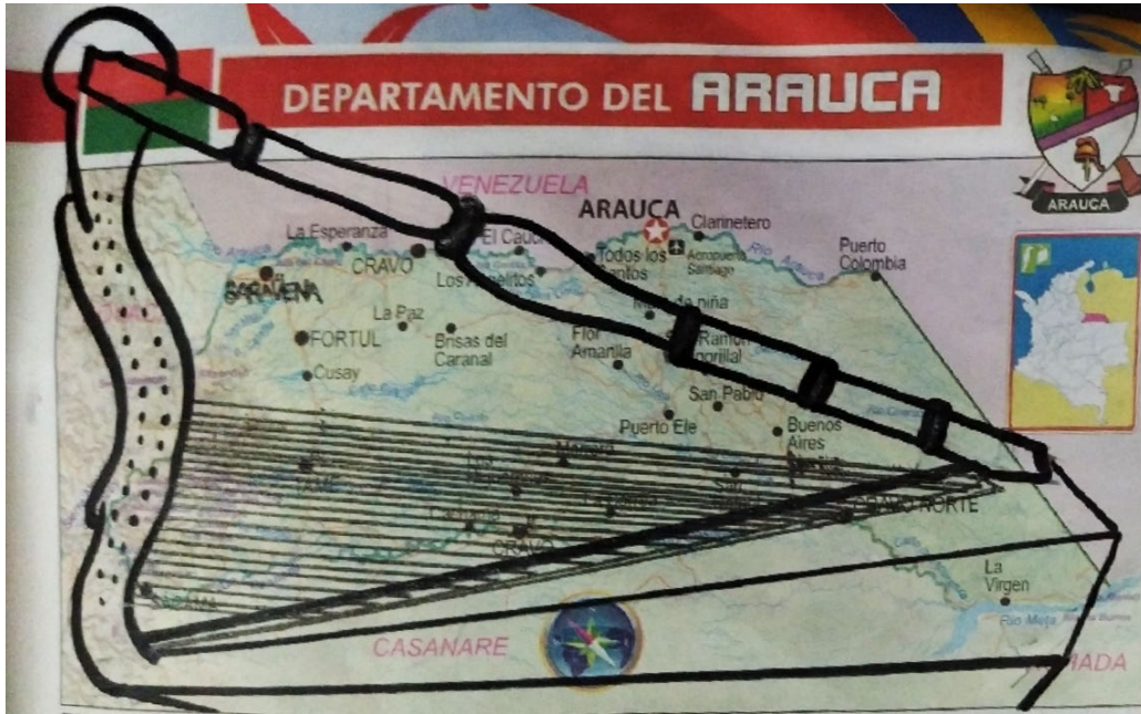
Ilustración 13 Cartografía Arauca (Gelvez, 2020)