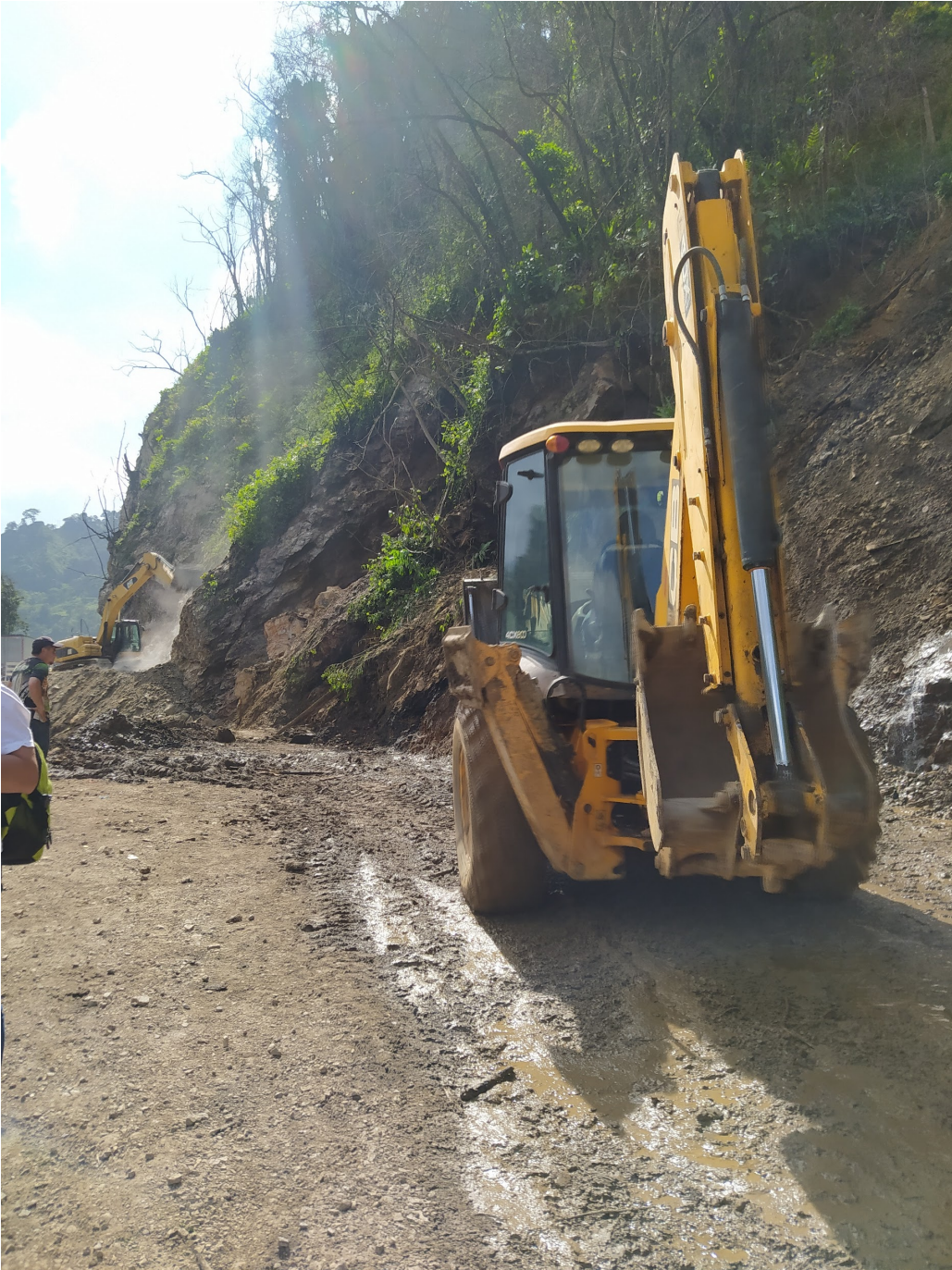
Figura 27- Transbordo (Gelvez, 2022)