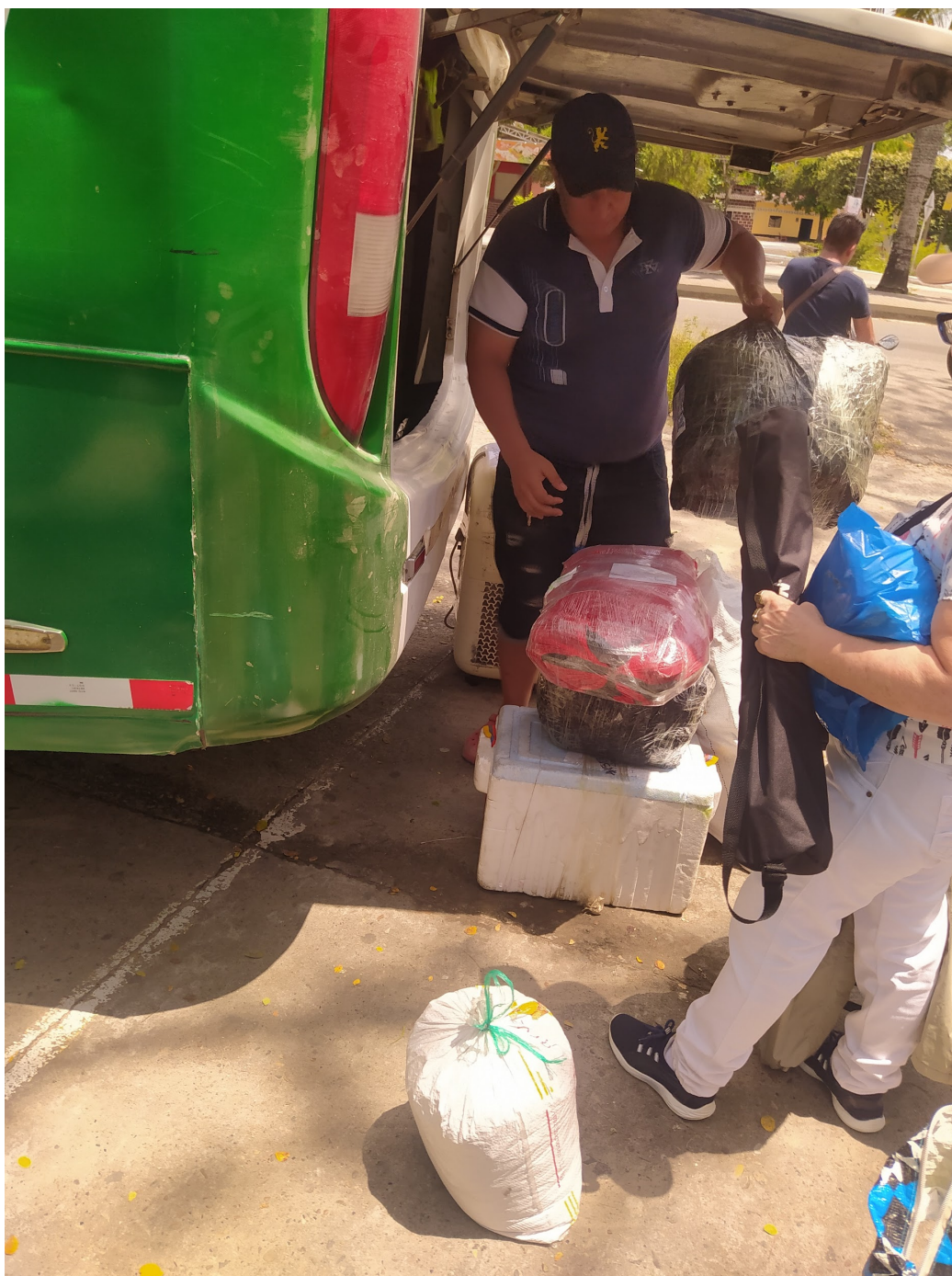
Ilustración 25 inicio del viaje del elemento tierra (Gelvez, 2022)

En este punto es interesante porque se elige uno de los transportes más antiguos y que fue de los primeros en explorar las vías que conducen de los Santanderes a Saravena, que tiene por nombre Cotranal.