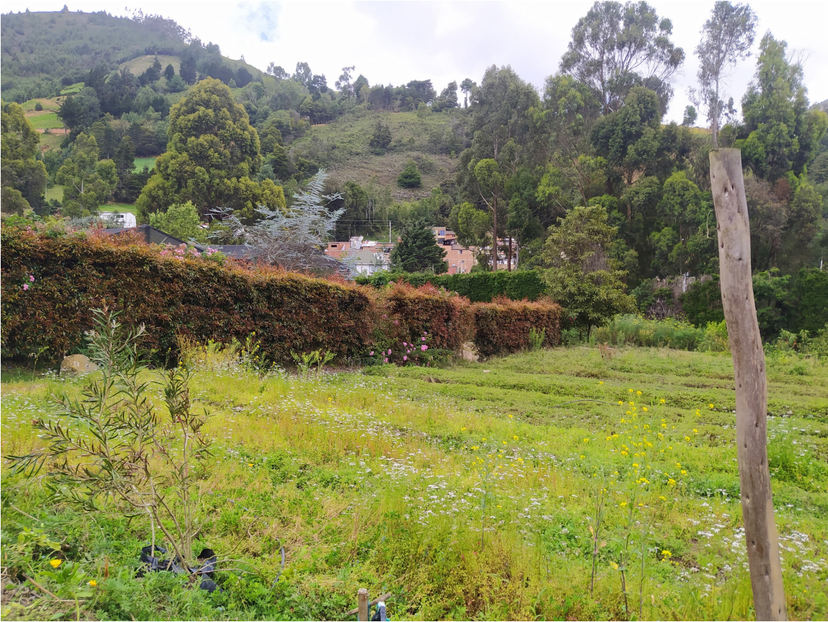
Figura 30- Lateral del lugar (Gelvez, 2022)