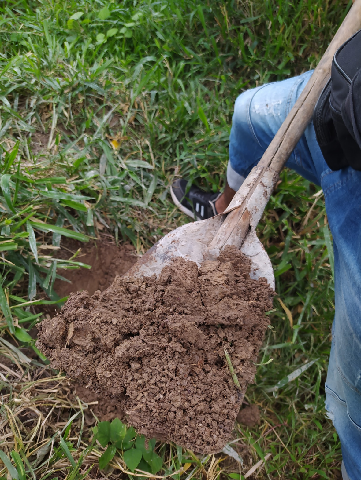
Ilustración 23 Excavación para obtener tierra (Gelvez,2022)