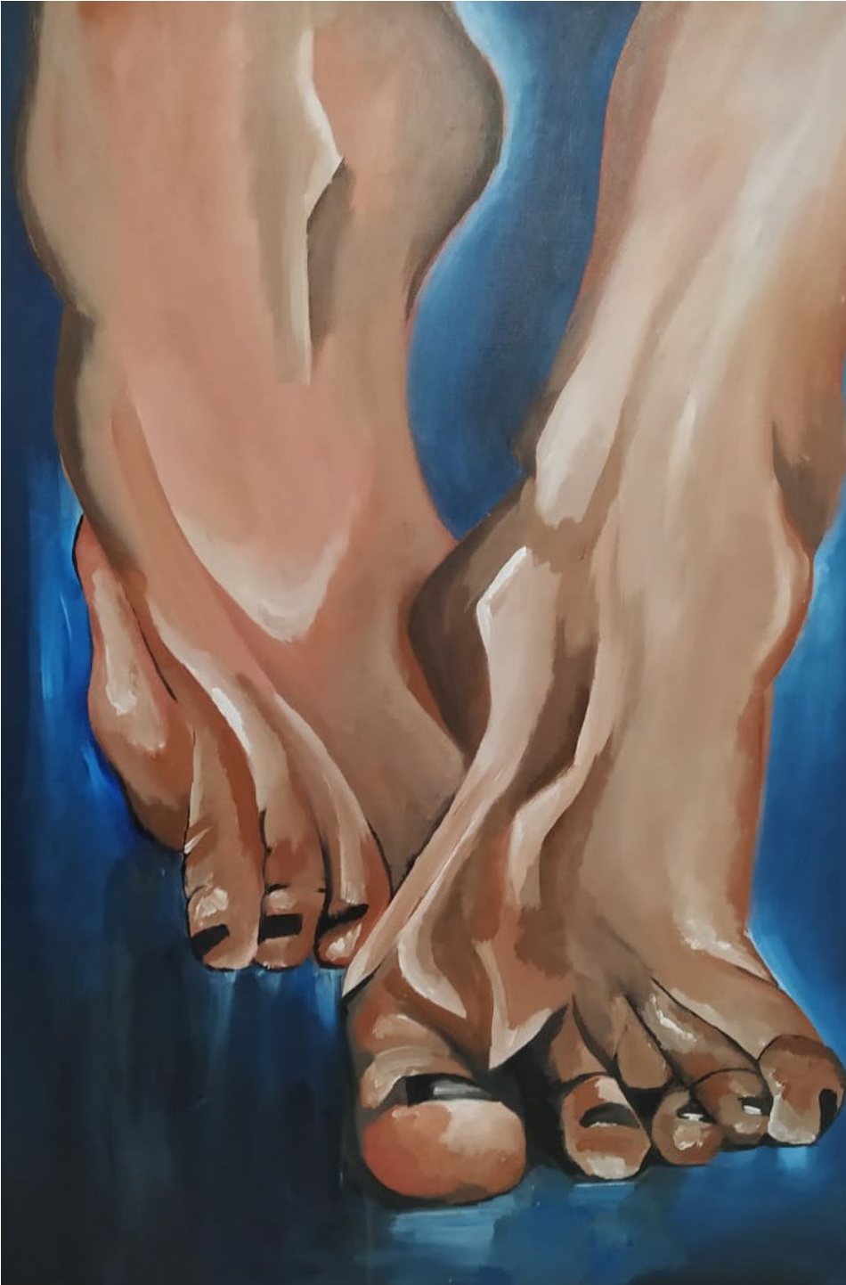
Ilustración 20 Pies descalzos (Gelvez,2020)