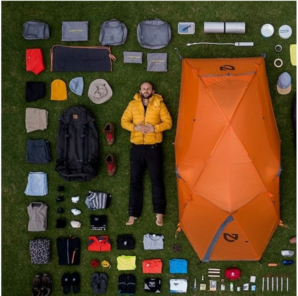
Ilustración 3 Autorretrato de Emilio Aparicio Rodríguez (Rodríguez, extraída de facebook del fotógrafo, 2019)