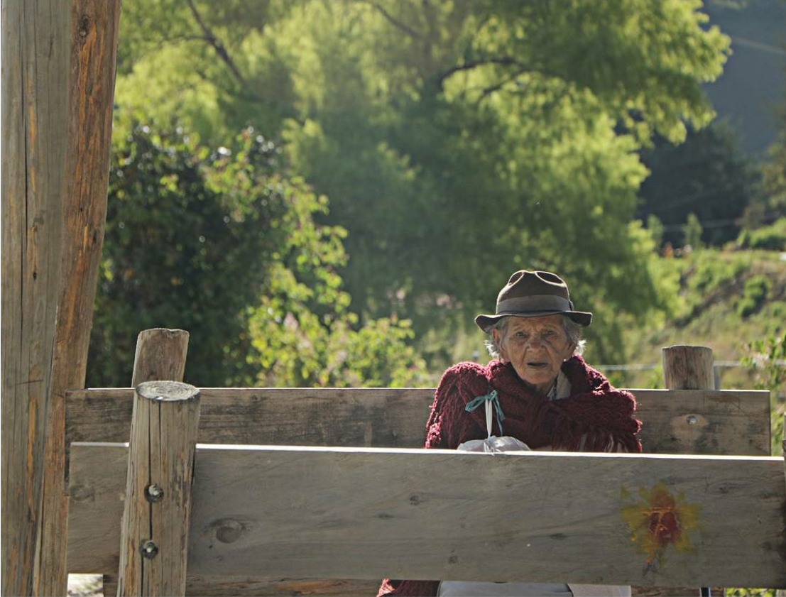
Ilustración 8 Bajo la sombra del cansancio (Higuerra, 2017)