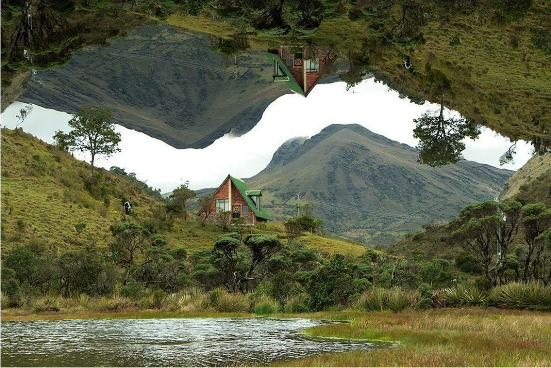
Ilustración 9 Proximidades (Higuerra, 2018)