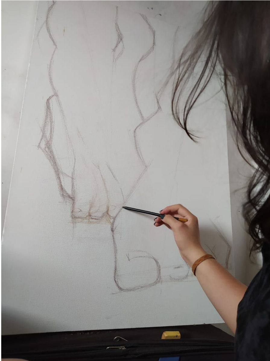
Ilustración 19 proceso de creación (Gelvez,2020)