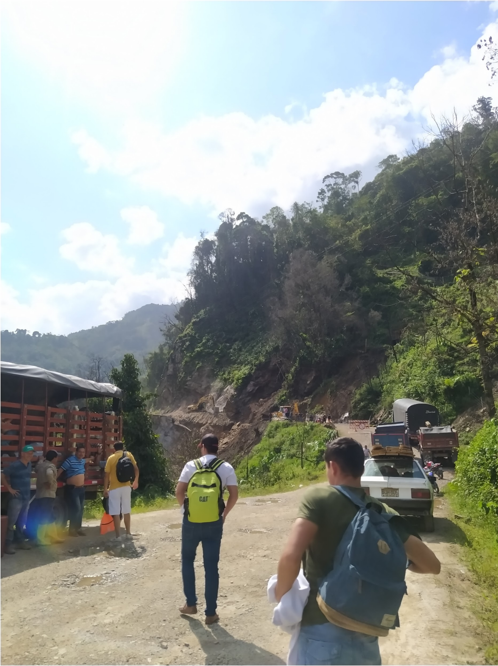
Ilustración 27 Soberanía ( Gelvez, 2022)

esa región el elemento que me ayudan a cargar, me cuestionaban el hecho de llevar tierra, mientras bromeábamos del derrumbe y lo pesada que estaba la tierra continuamos hasta llegar a Pamplona, destino donde se piensa integrar el elemento y darle vida a la obra.