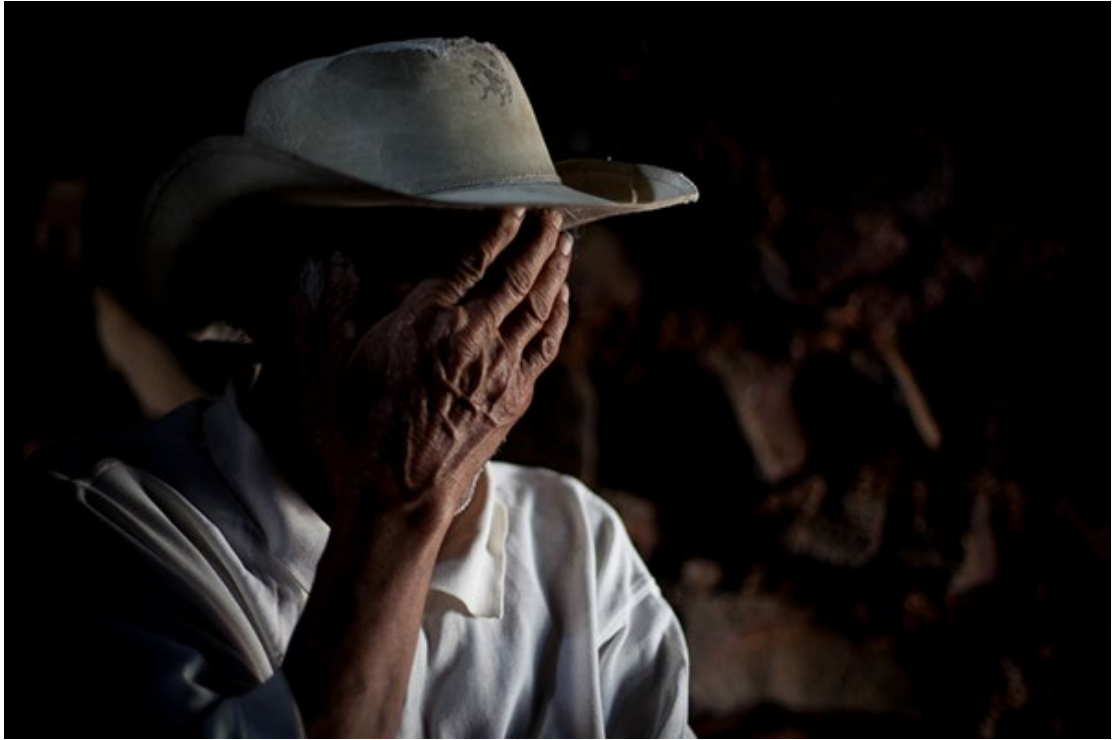
Ilustración 4 De Boyacá en los campo (Rodríguez, 2014)

porque mi interés por representar esos espacios rurales también están muy presentes en mi proceso creativo y también porque en esta serie veo reflejado un poco mi estilo.