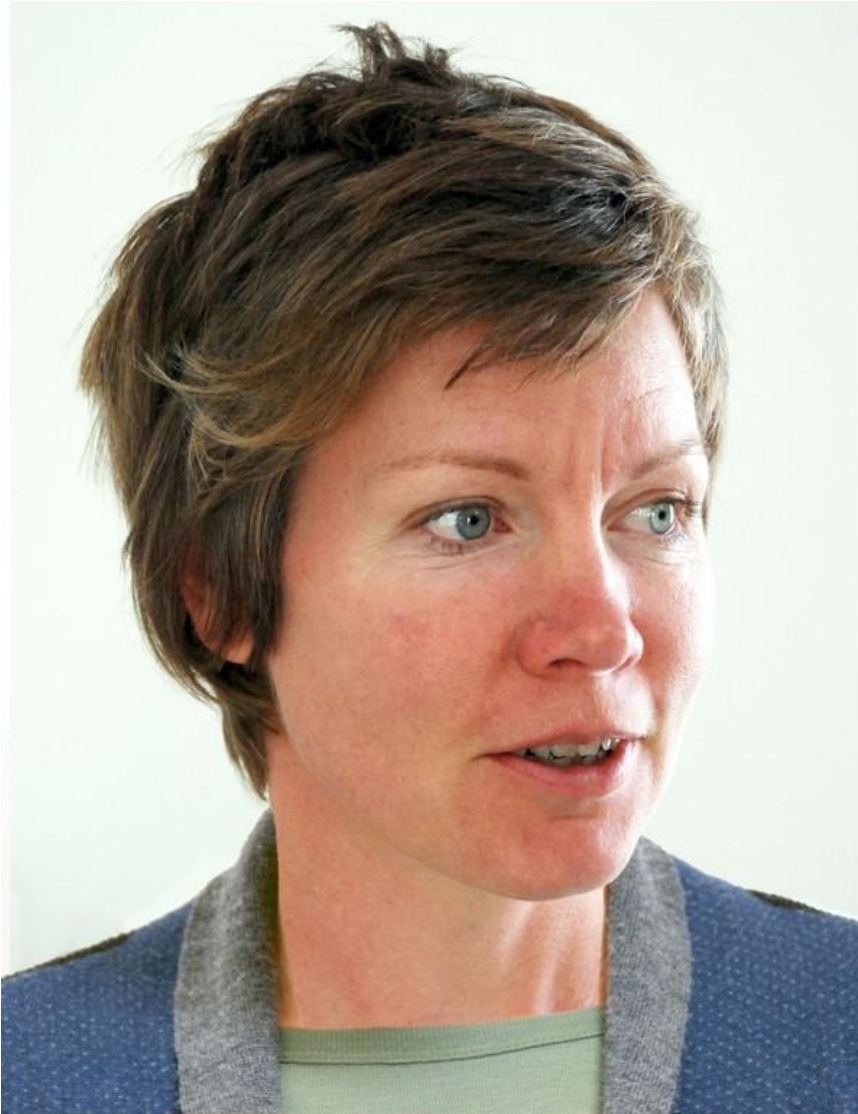
Ilustración 1 Retrato de Abigail Reynolds (National gallery, 2012)

Abigail Reynolds reside en St Just, Cornwall, cuenta con estudios en Porthmeor en St Ives. en literatura inglesa en el St. Catherine 's College de la Universidad de Oxford, además, estudió la maestría en Bellas Artes en el Goldsmiths College de la Universidad de