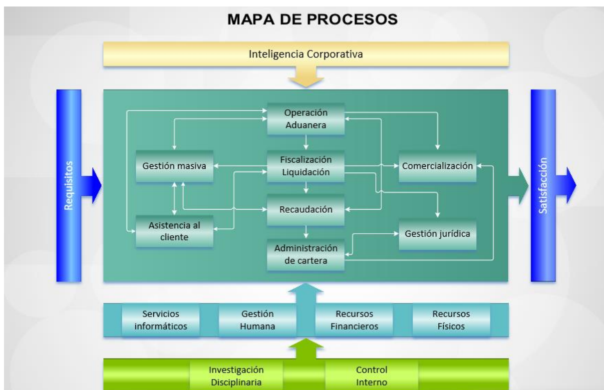
Ilustración 1: mapa de procesos 2019/2020

Procesos de Evaluación y Control: Permiten garantizar un ejercicio de medición, retroalimentación y ajuste, de tal forma que la entidad alcance los resultados propuestos. Incluye procesos de medición, seguimiento y auditoría interna, acciones correctivas y preventivas, y son una parte integral de los procesos estratégicos, de apoyo y los misionales.