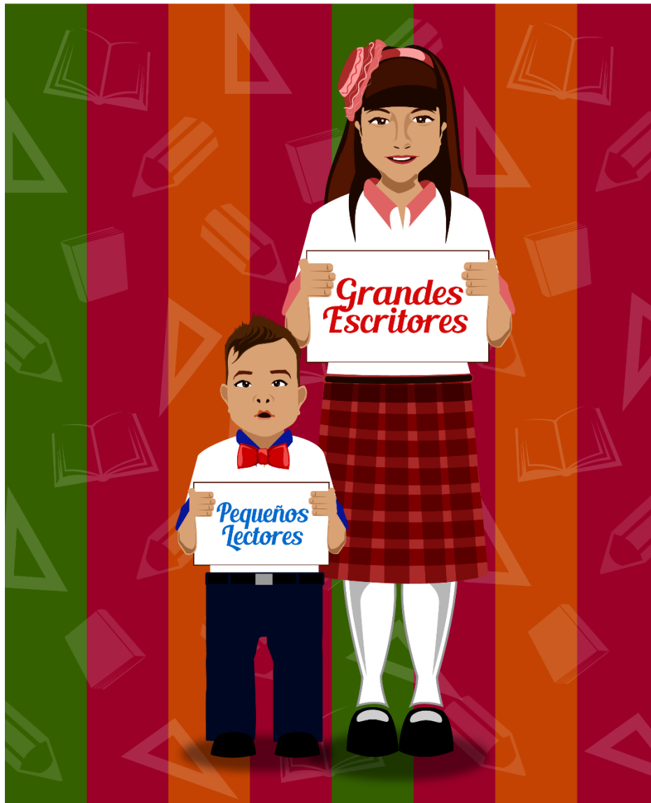
Ilustración 1. Imagen de la propuesta