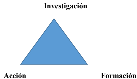
Ilustración 1: Triángulo de Lewin