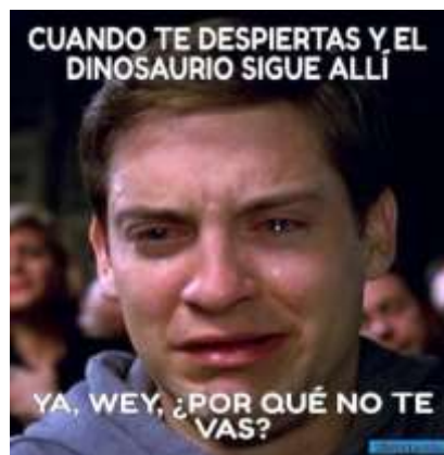
Imagen N°1: la relación estructural del meme

Es así que en su división estructural, la microestructura alude a la composición y relación entre las palabras o proposiciones que componen el meme y, en este sentido amplio, la macroestructura converge en la relación entre las proposiciones para crear un contenido semántico y relacionante con la imagen; seguido, la superestructura compone la sinergia establecida entre las imágenes y el texto, entre las proposiciones y las macroestructuras, así genera procesos pragmáticos, ya que el texto cubre una necesidad comunicativa y, además, se adapta a un formato de expresión textual. (Ver imagen N° 1: la relación estructural del meme).