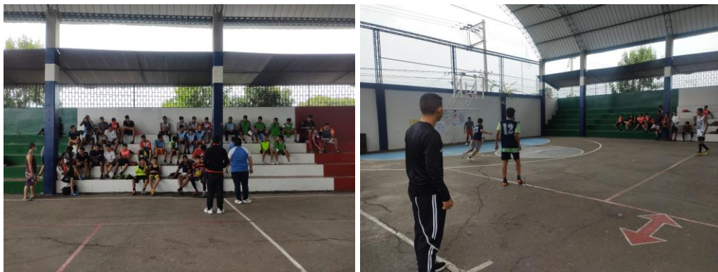
Ilustración 13 extracurricular 2