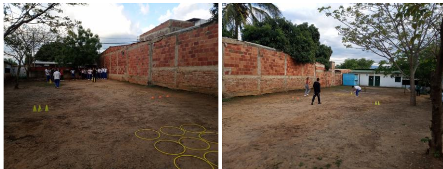
Ilustración 3 triqui

Variante: lanzar la pelota hacia arriba.