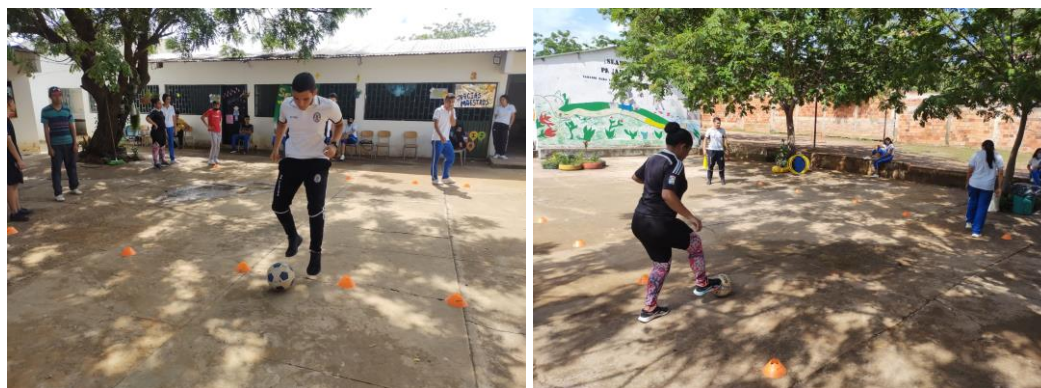
Ilustración 6 salto y transporte de balón

Variante: transporte frontal y hacia atrás y lateral.