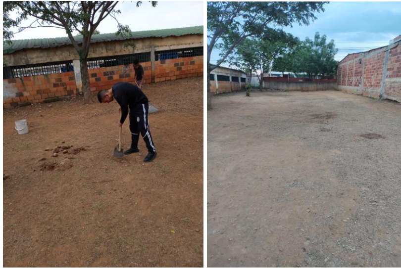
Ilustración 12 extracurricular 1