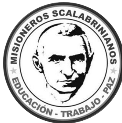
Ilustración 2 Escudos