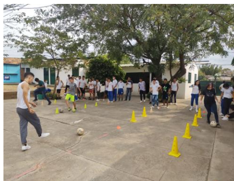
Ilustración 7 Borde interno y externo

El primer equipo que todos sus integrantes realicen el ejercicio es el ganador de un punto.