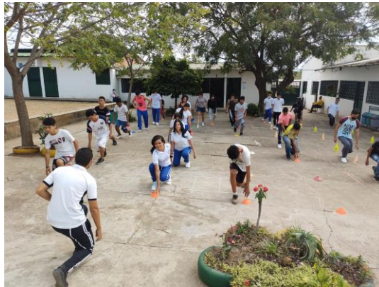
Ilustración 8 adivina quién es el jefe

El jefe Deberá hacer movimientos con su cuerpo y los demás alumnos deben seguirlos, el alumno que sacamos del salón al principio deberá ingresar nuevamente y adivinar quién es el jefe en turno, mientras todos realizan los movimientos al mismo tiempo que el “jefe”.