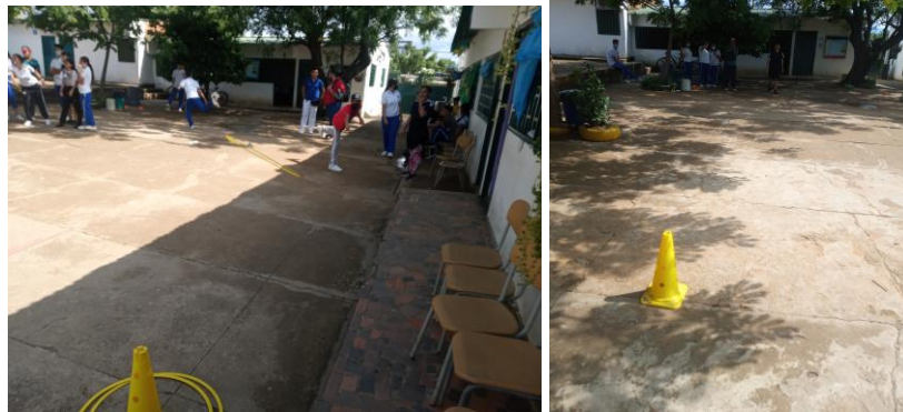
Ilustración 5 lanzamiento de aro al cono

Los alumnos deberán tomar un aro y cruzar una serie de obstáculos y posteriormente lanzar el aro al cono y enconarlo, esto se debe de hacer desde una distancia de 3 o 4 metros, si el alumno no lo encoca en el cono deberá volver rápidamente para que su compañero salga y haga su intento de lanzarlo.