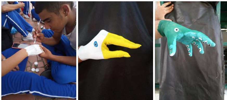
Ilustración 11 paint

Los estudiantes deberán pintar un animal en sus propias manos, con ayuda de temperas.