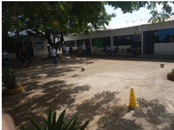
Ilustración 10 tiro al cono

El primer equipo que logre derribar el cono 4 veces ganara el juego.