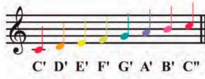
Imagen tomada de (Alarcón, 2017, p 1).

Correspondencia entre nota-color en el pentagrama en el sistema Boomwhacker Color Code. Tomado de http://www.gear4music.es/es/Bateria-y-percusion/Boomwhackers-Set-de-Tubos-de-Percusion-Boomophone-XTS/MUO