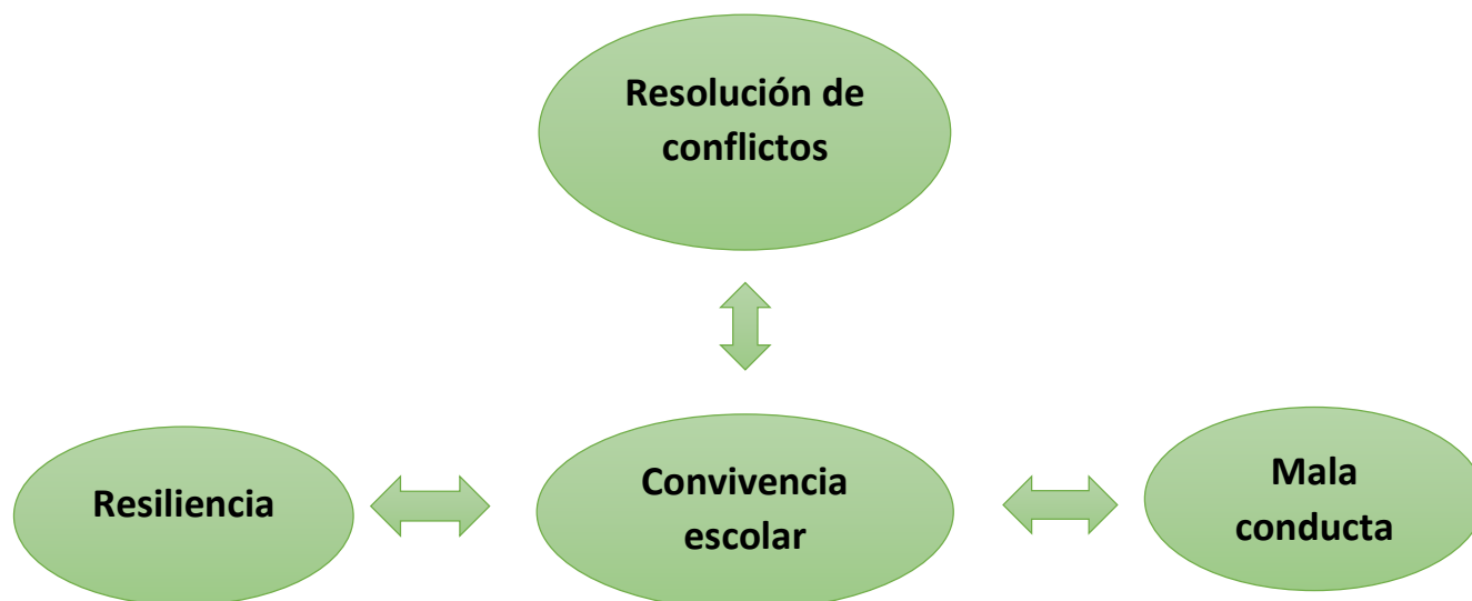
Gráfica 2. Procedimiento y Análisis de los Datos

presenta en el siguiente grafico, en el cual se puede evidenciar que los procesos de convivencia escolar se ven influenciados por prácticas resilientes y el conflicto en el aula.