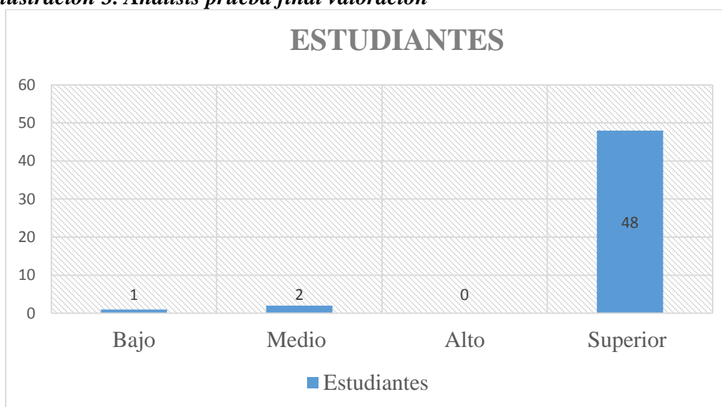
Ilustración 3. Análisis prueba final valoración

Con su respecto a su análisis se destaca que el eje de producción textual no presenta gran cantidad de desacierto, por el contrario se evidencia en su gran mayoría los aciertos.