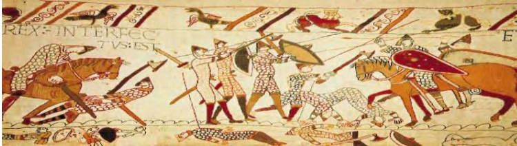
Fig. (2) Tapiz de Bayeux siglo

A lo largo de la historia se ha narrado visualmente utilizándose distintos soportes y materiales. Aquí se muestra un ejemplo. Fig. (2)