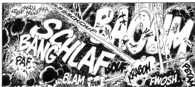
Fig. 1 (Onomatopeyas)