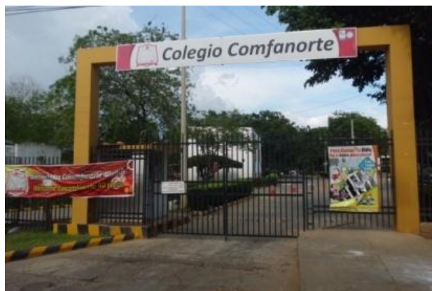
Figura x. Fachada IE Colegio Comfanorte