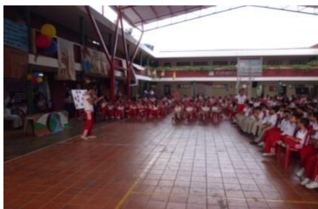
Figura X. Personal estudiantil.