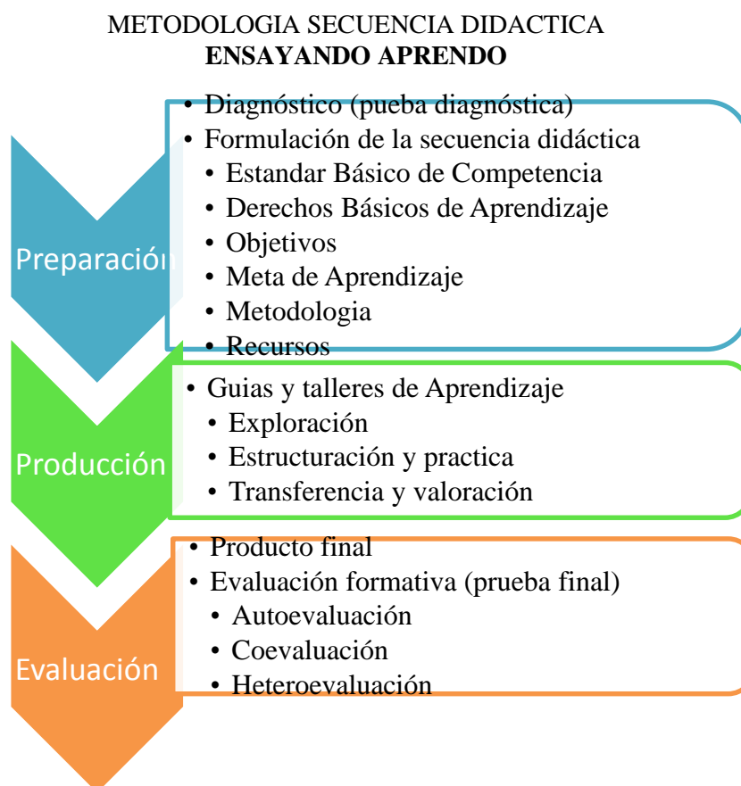
Figura 5. Esquema metodológico de la Secuencia Didáctica "Ensayando Aprender"