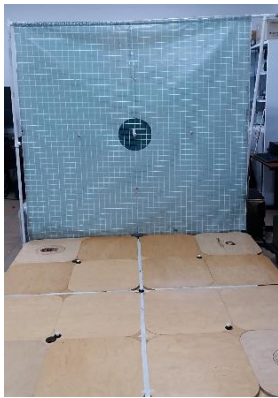
Figura 2. Plataforma registro prueba cinemática

Esta prueba se realiza en una plataforma de madera la cual lleva a su vez unas medidas de 2 metros de largo por 2 metros de ancho dentro de este mismo recuadro se marcan otras medidas de 1 metro de largo y ancho formando a si cuatro cuadros en cada recuadro se ubican unos marcadores en la esquina de cada cuadro y en la parte posterior una cuadrícula con las mismas medidas y marcadores de la plataforma, como se observa en la figura 2. En la mitad de la plataforma se ubica cada pareja un hombre y una mujer quienes mientras ejecutan el zapateo y escubillado durante 10 segundos, son grabados con una cámara Nikon Molón Coolpix Pro en modo video.