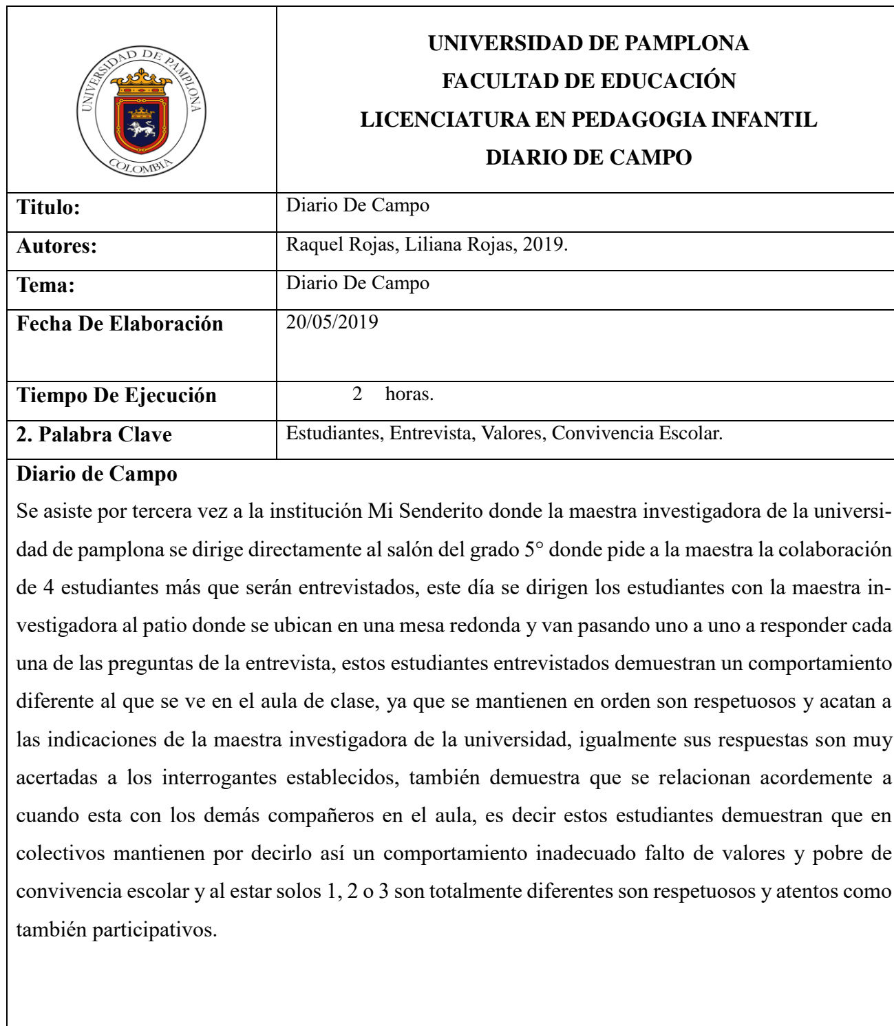
Tabla 14. Diario de campo 3