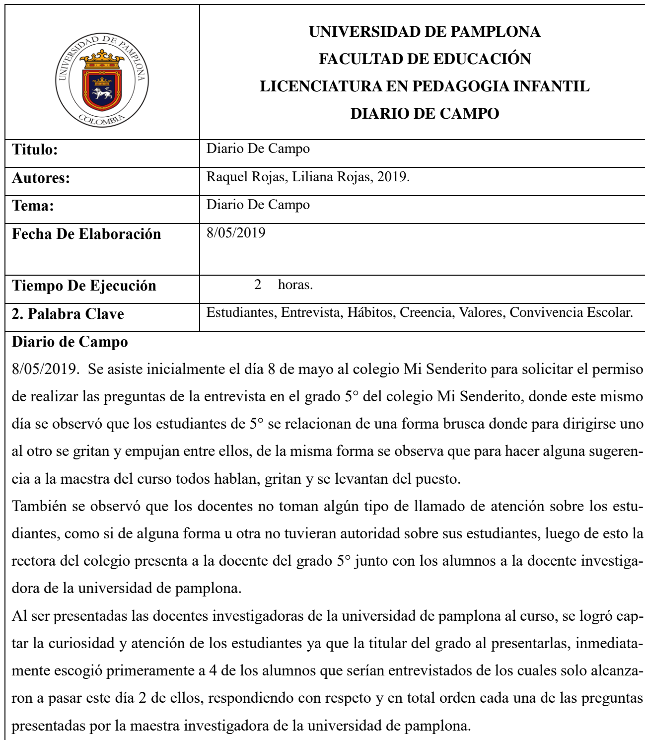
Tabla 12. Diario de Campo 1