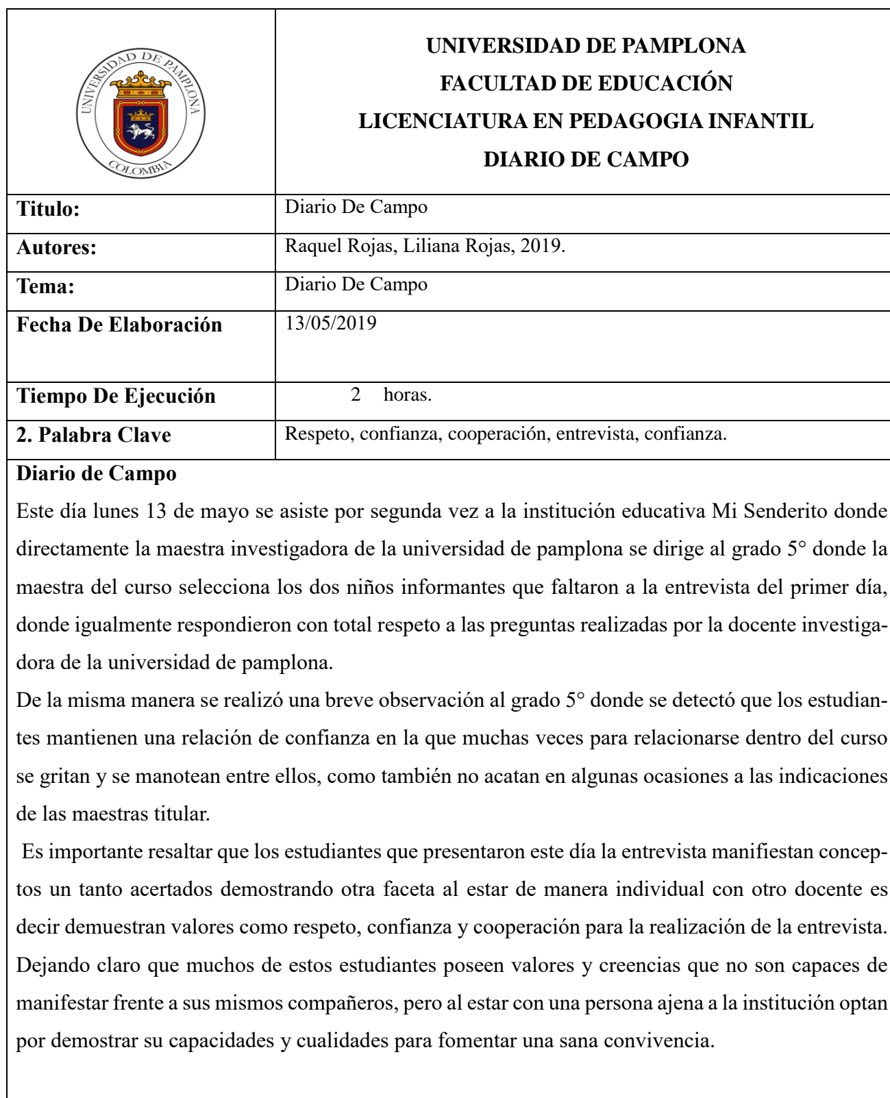
Tabla 13. Diario de campo 2