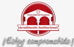
Figura 1: fuente propia