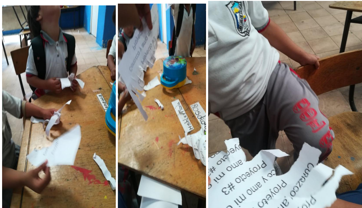
Figura 5. Actividad rasgando me divierto