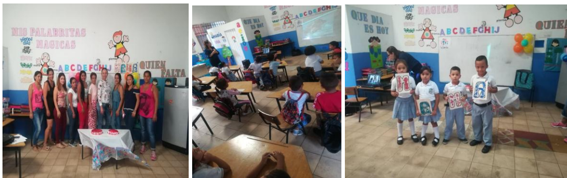
Figura 11. Celebración día de las madres

cargo de los niños del grado preescolar, poesías, video y canción a lucido al día de la madre a cargo de la docente en formación finalmente se realizó la entrega de un actividad hecha en clase como obsequio para las mamás dando un compartir al final.