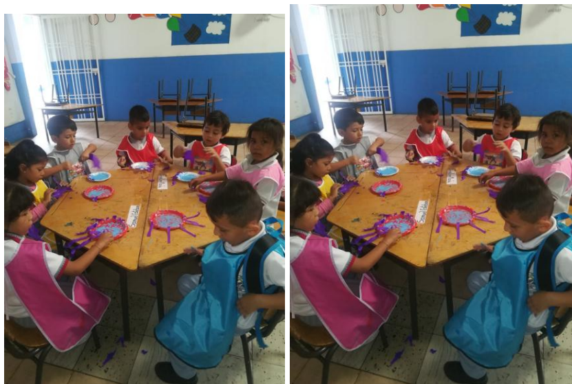
Figura 6. Actividad pintando ando