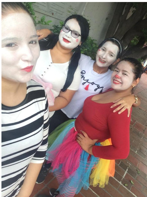
Figura 10. Celebración día del niño

Celebración día del niño: se ejecutó en una jornada continua donde se realizaron diferentes actividades programadas para ellos tales como: la decoración del colegio, acto de mimos a cargo de las docentes de la universidad de Pamplona, payasos y muestra escenográfica a cargo del ejército nacional y seguidamente se les entregó en cada salón de clase un compartir.