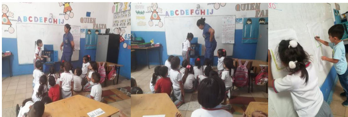
Figura 9. Actividad máquina de sumar