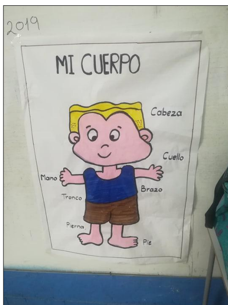
Figura 1. Actividad Conozco mi cuerpo