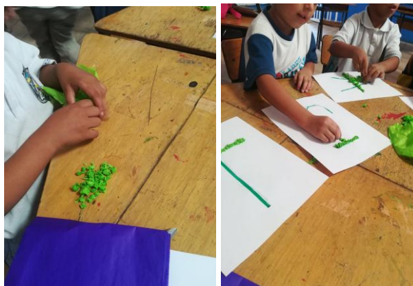
Figura 7. Actividad soy creativo