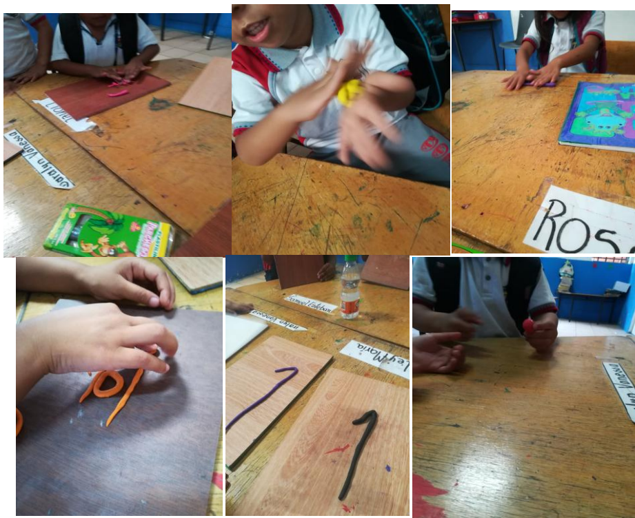
Figura 4. Actividad incentivo a mis estudiantes