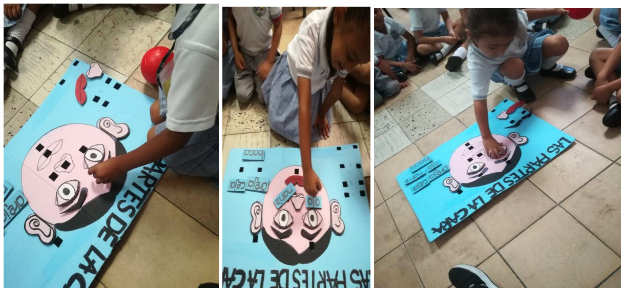
Figura 2. Actividad “mi carita