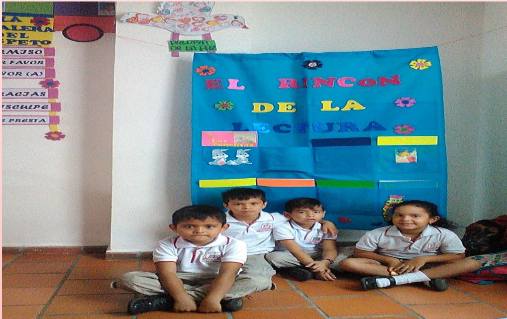
FIGURA 3 Actividades