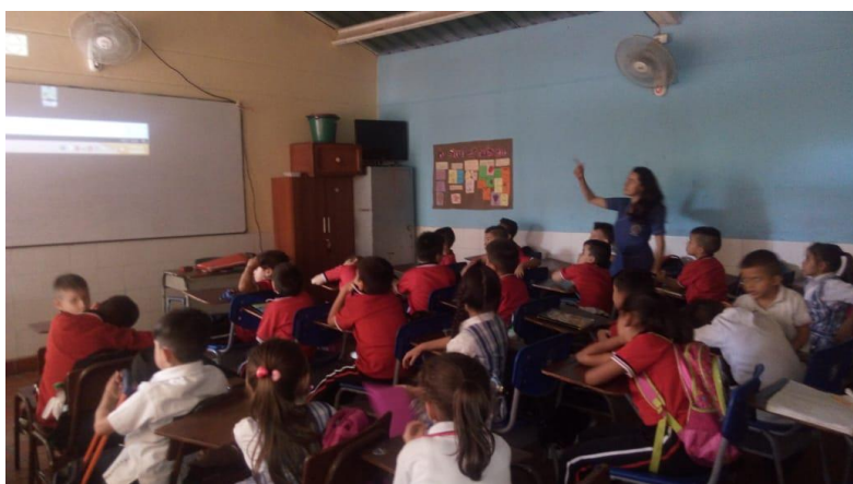
Foto 1. Video sobre la historia de la música Mozart