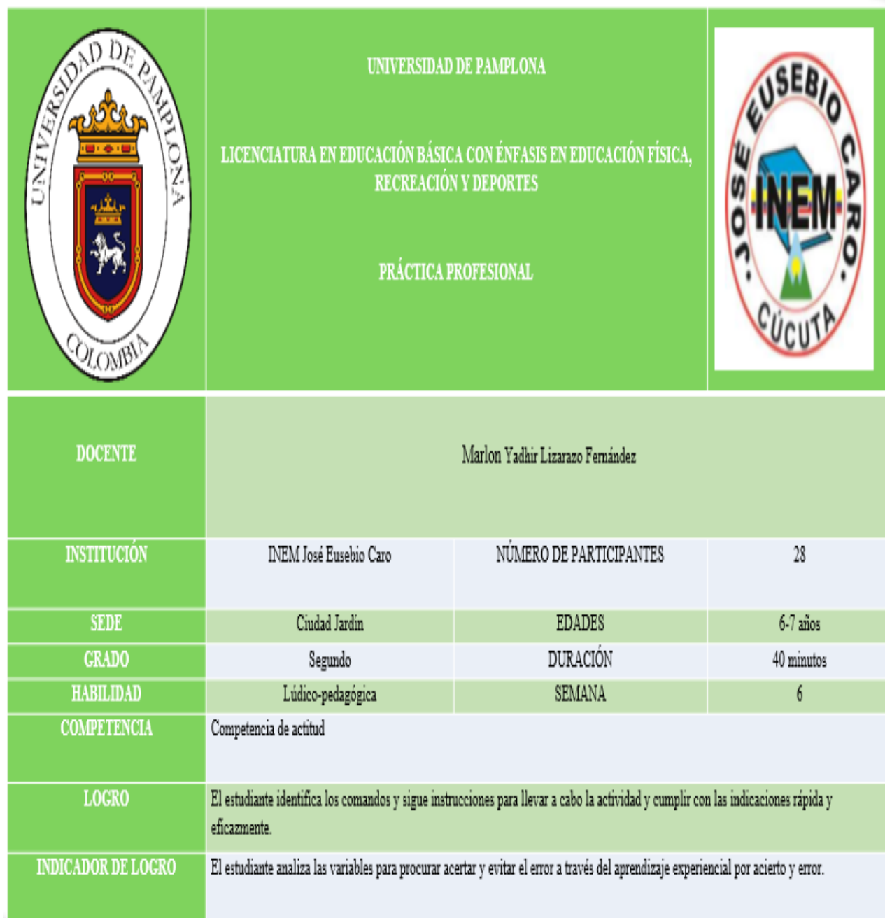
Tabla nº 6