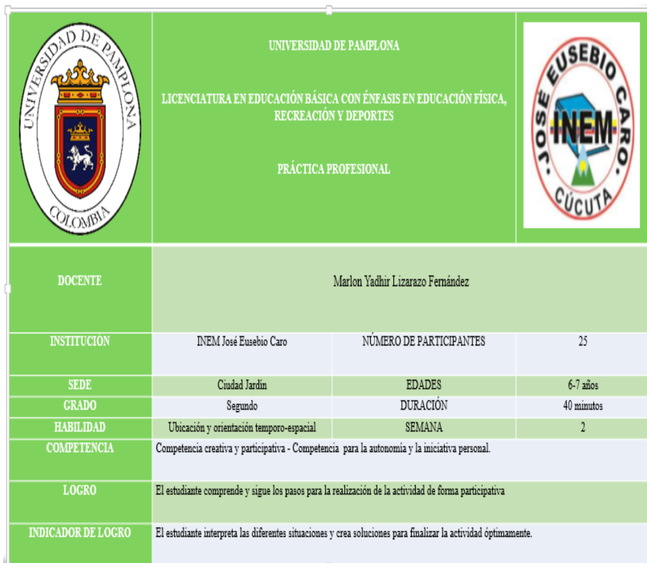
Tabla nº 5