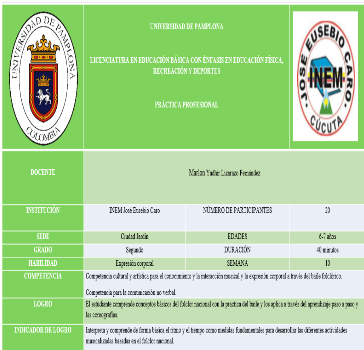
Tabla nº 7