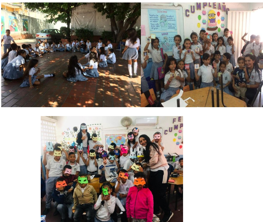
Fig. 4. Evidencias 2

Lugar: dentro y fuera del salón del salón de clase