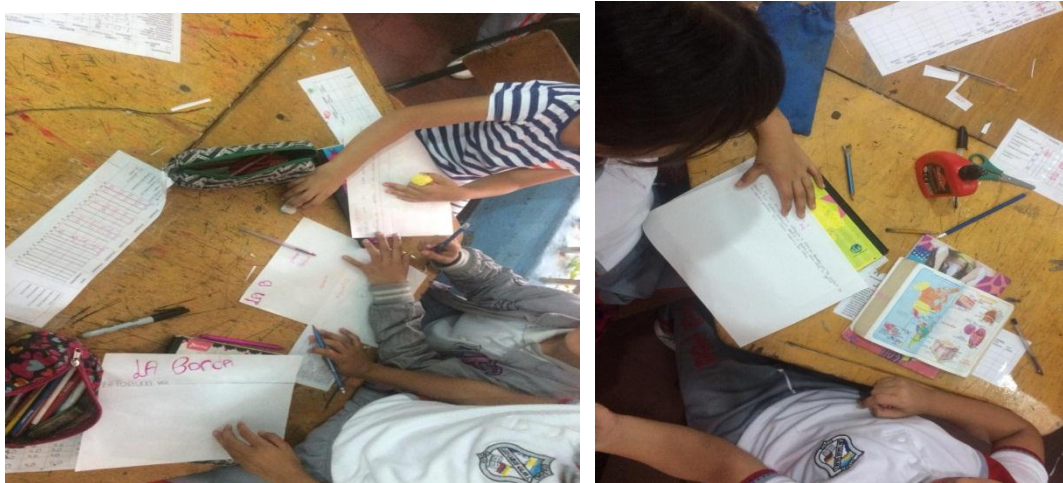
Fig. 5. Evidencia 3

A partir de esta actividad se lograba reforzar el proceso lectoescritor de los niños resaltado la importancia que tiene los valores en una persona.