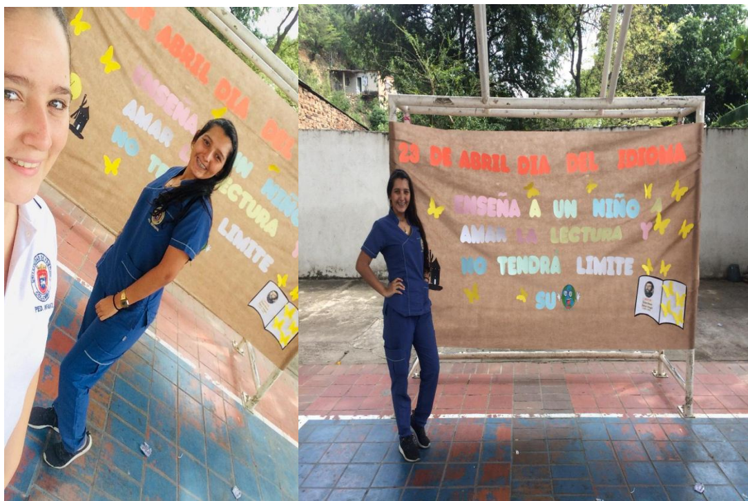
Fig. 7. Evidencia 5

realizaron la celebración del día del idioma resalta la importancia de esta celebración mediante actividades y mensajes alusivos a este día.