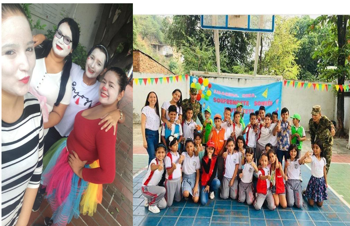
Fig. 6. Evidencia 4

5.1.1 CELEBRACIÓN DEL DÍA DEL NIÑO: El personal docente del colegio Luis Carlos Galán sede alianza para el progreso en conjunto con las maestra en formación realizaron la celebración del día del niño en la cual se realizaron una serie de actividades entre ellas bailes, concursos, obra de teatro, animaciones.