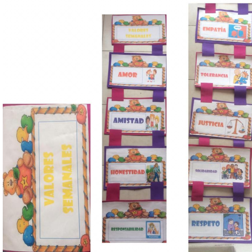
Fig. 1. Valores

A partir de la actividad el valor de la semana se pretende reforzar la formación de los valores de los educandos mediante estrategias didácticas donde el valor de la semana cumple un papel muy importante en el desarrollo de cada actividad.