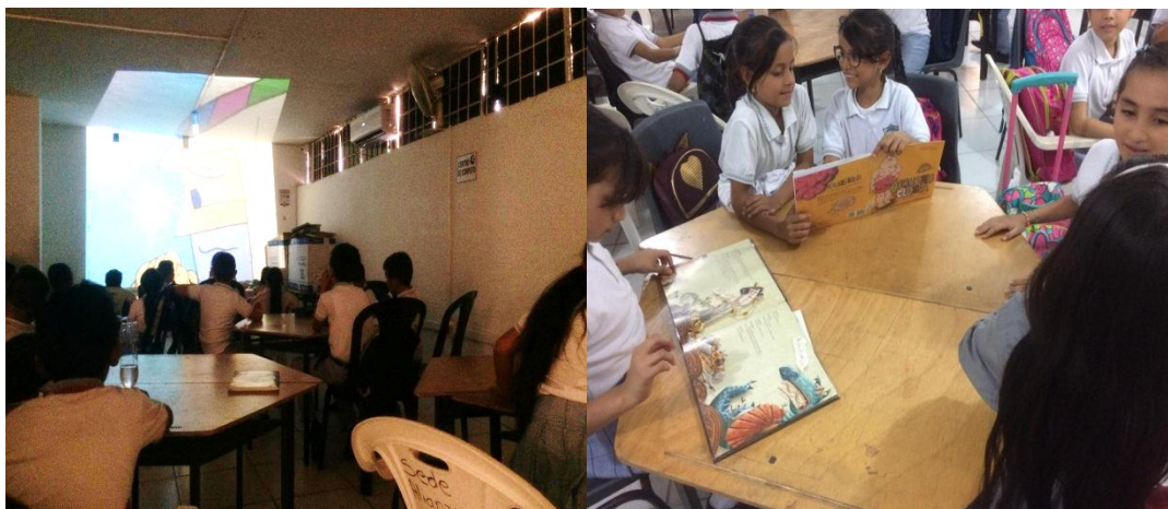
Fig. 3. Evidencias 1

A partir de esta actividad se logró trabajar la lectura de forma didácticas.