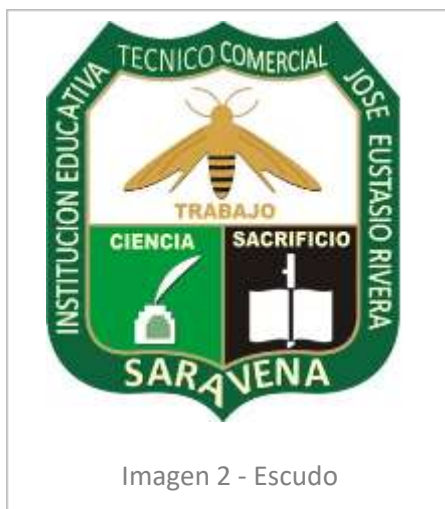
Imagen 2 - Escudo

Una verde, sobre la cual se ilustra un tintero y su pluma, y en la otra un libro abierto sobre fondo negro.