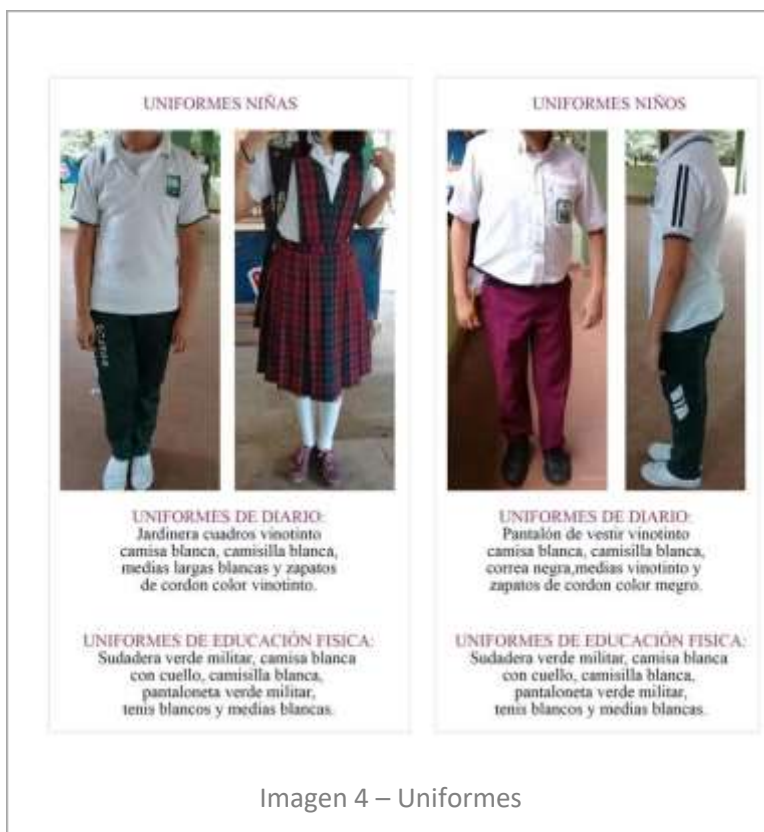
Imagen 4 – Uniformes

PARAGRAFO 2: La no justificación de la presentación personal y /o porte del uniforme, acarreará seguimiento y valoración al momento de calificar el comportamiento.