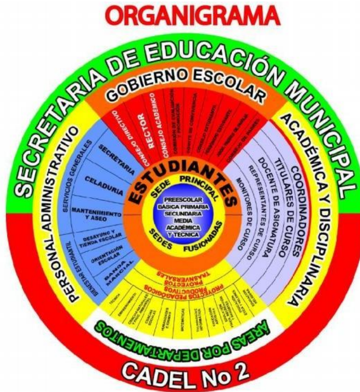
Figura 3: Organigrama Institución