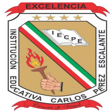
Figura 1: Escudo Institución educativa

En el cuartel superior se muestra un libro donde se señalan las siglas IECPE que significan Institución Educativa Carlos Pérez Escalante. El libro significa la sabiduría y los conocimientos. En el cuartel inferior se encuentra