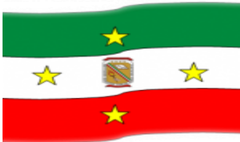
Figura 2: Bandera Institución educativa

La Bandera de la Institución Educativa Carlos Pérez Escalante está formada por tres colores: Rojo, Blanco y Verde cada uno de los cuales está distribuido en tres franjas horizontales de igual longitud y tamaño.