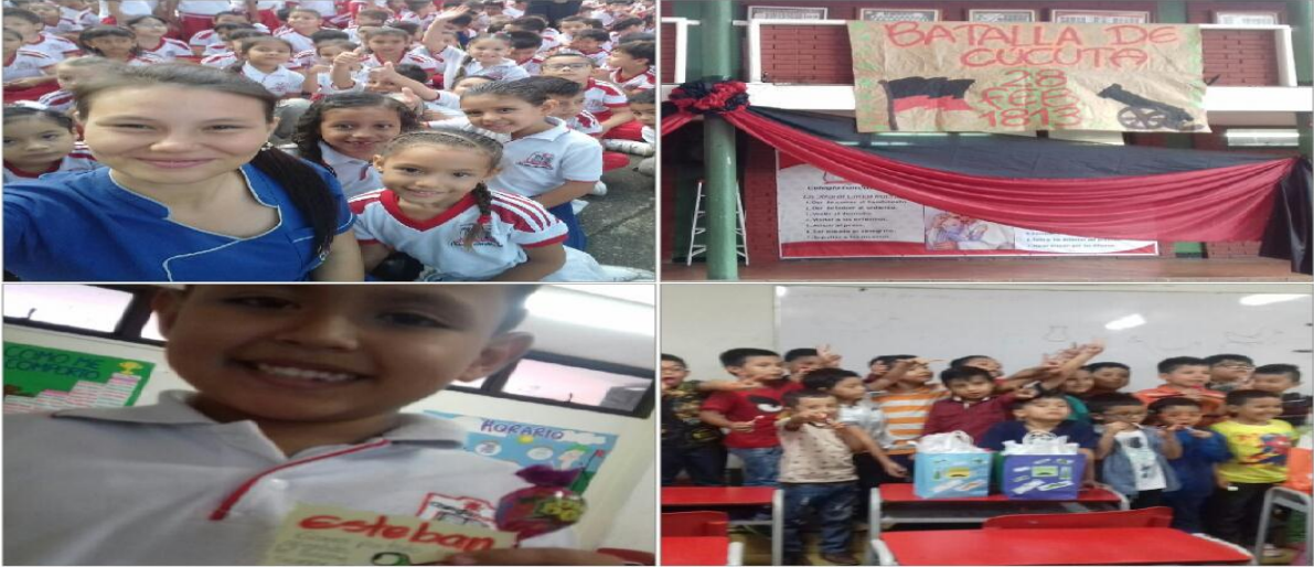
Figura 3. Actividades interinstitucionales