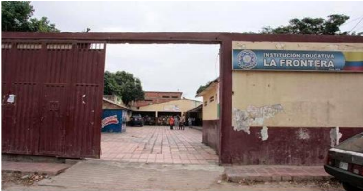
Figura 1. Fachada de la Institución Educativa La Frontera