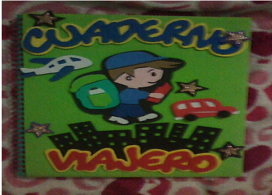
Figura 4. El cuaderno viajero