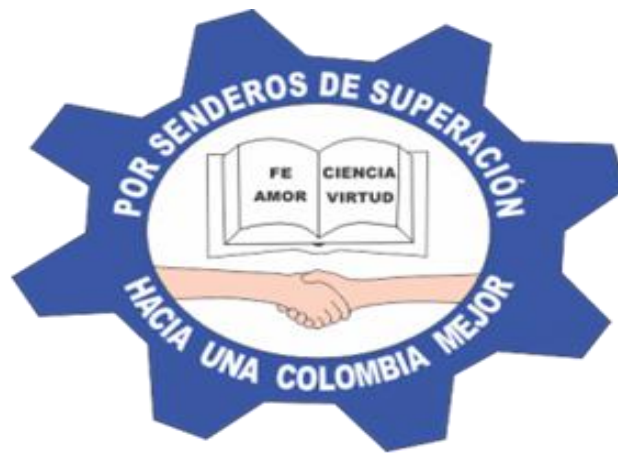
Figura 2. Escudo de la Institución Educativa

superación hacia una Colombia mejor”. El nombre de la Institución va formando un círculo. La pieza de engranaje simboliza que cada uno de los miembros de la comunidad educativa es importante y hace parte fundamental de un gran complejo institucional, que anda o funciona en la medida que cada uno de sus miembros lo hace, y que la labor de cada uno impulsa la de los demás de una manera sistémica y dinámica, haciendo parte de un todo. Véase Figura 2