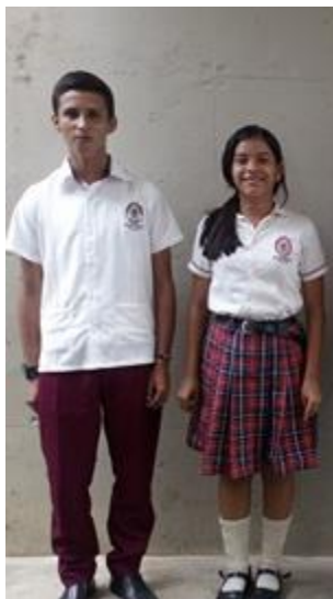
Figura 2. Uniforme de diario

Los hombres usan pantalón en tela dril beige oscuro, un camibuso color beige faraya celeste de cuello sport extendido tipo chemisse, medias de color beige y zapatos negros. En cuanto a las mujeres, ellas usan una falda de short de tela dril beige hasta la rodilla, camibuso beige faraya de cuello sport extendido tipo chemisse, medias de color beige y zapatos negros.