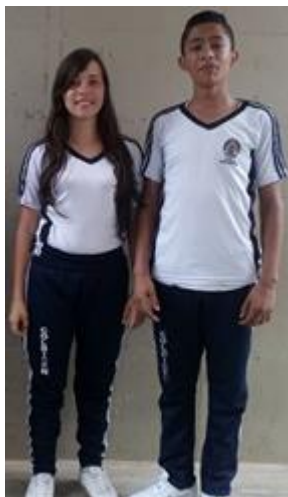
Figura 3. Uniforme de educación física