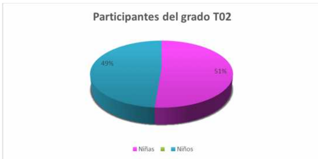
Gráfica 1. Participantes del grado T02

El total de participantes fueron 39 estudiantes de los cuales 20 eran niñas (51%) y 19 niños (49%) esta frecuencia se evidencia mejor en la Gráfica 1