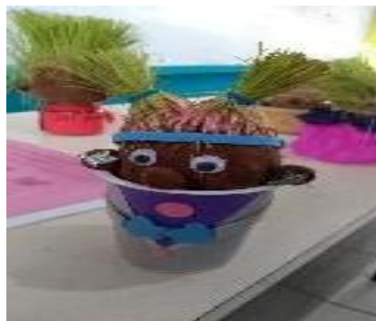
Figura 5. El señor pasto. (Experimento sobre el proceso de germinación)