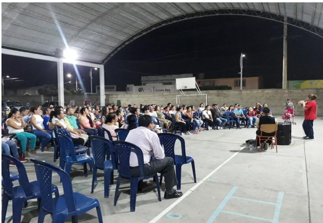
Figura 7. Escuela de padres

Se llevó a cabo en la sede principal del colegio San Bartolomé, el cual debían asistir todos los padres de familia (papá y mamá), donde se llevó a cabo la temática de pautas de crianza y patrones de comportamiento, dirigida por la Dr. Fonoaudióloga. Inicialmente las docentes en formación organizaron el espacio para la capacitación, luego emplearon una reflexión acerca de la temática, además realizaron la oración y dieron apertura al programa.