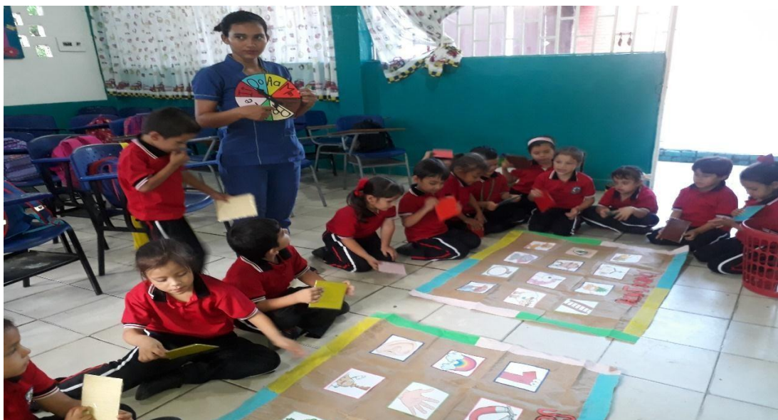
Figura 4. Jugando y aprendiendo con la ruleta.

Finalmente el grupo que haya logrado tapar todas las imágenes y producir correctamente la inicial de la letra o palabra, será el equipo ganador. Este juego o actividad es muy importante para que los niños se inicien en el proceso de lectura y escritura.