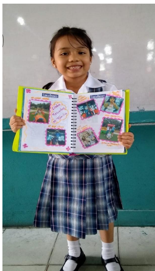
Figura 1. Proyecto escritor: el señor copito