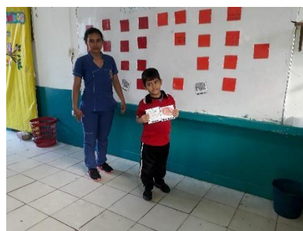
Figura 3. Memóreme