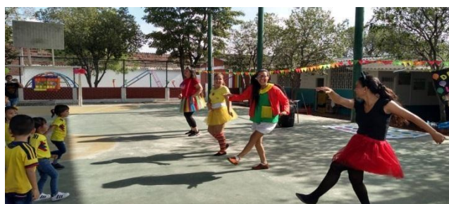
Figura 8. Celebración día del niño