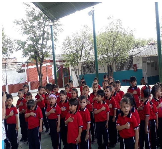
Figura 9. Izada de bandera sobre el día del trabajador, día de la madre y de la virgen María