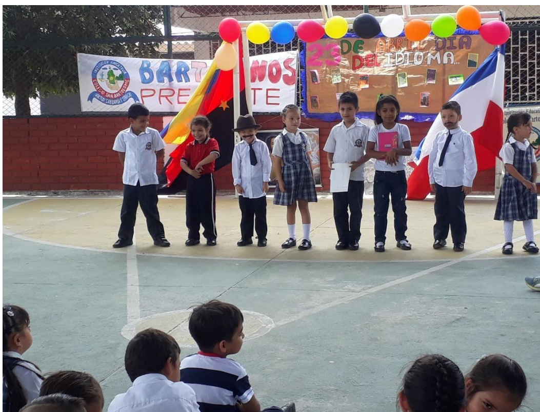
Figura 10. Izada de bandera: Día del idioma

Las docentes en formación fueron las encargadas de esta actividad pedagógica, en este día se decoró la institución, se realizó una pancarta grande alusiva al día 23 de abril día del idioma, las docentes en formación realizaron el programa de la izada de bandera y fueron las encargadas de llevarla a cabo, también le asignó un papel o rol sobre un autor o escritor colombiano y una pequeña biografía del mismo y debía aprendérsela e ir con el vestuario asignado, además se ejecutaron más puntos sobre presentaciones acorde al día del idioma como: canciones, poemas y cuentos.