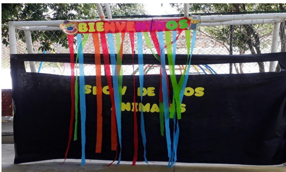
Figura 6. El show de los animales (teatro de títeres)

Descripción de la actividad: Esta se llevó a cabo de forma general con todos los estudiantes de la jornada de la tarde, encargado por las docentes en formación de práctica integral, el cual elaboraron el teatrín para el show de títeres, además se llevaron los animales en títere, se organizó un guion acerca de las características de los animales a modo de conversatorio con los estudiantes y realizando preguntas de conocimiento previo acerca de la temática que ya había sido vista en clase. A los estudiantes les encantó esta actividad, estuvieron muy atentos y motivados respondiendo y participando en las preguntas que se realizaron, además estaban muy animados y les favoreció en el proceso de enseñanza-aprendizaje y su aprendizaje fue significativo.