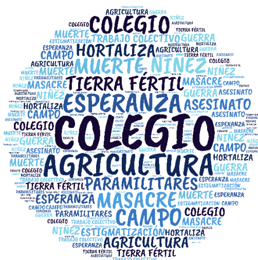
Figura 2. Nube de palabras categoría Memoria Histórica