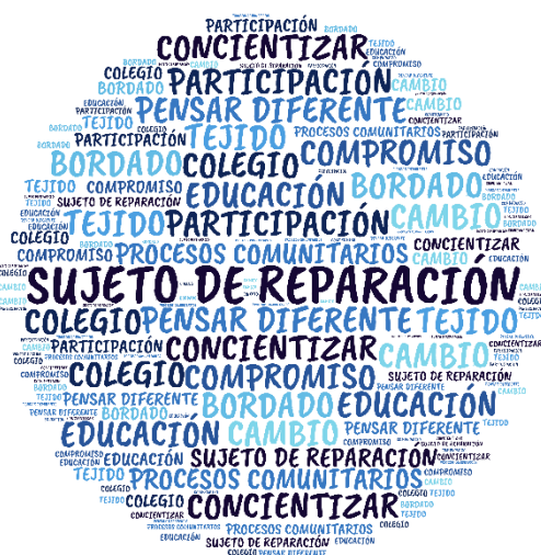
Figura 5. Nube de palabras categoría Cambio Social