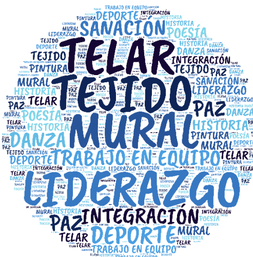
Figura 3. Nube de palabras categoría Narrativas de Paz