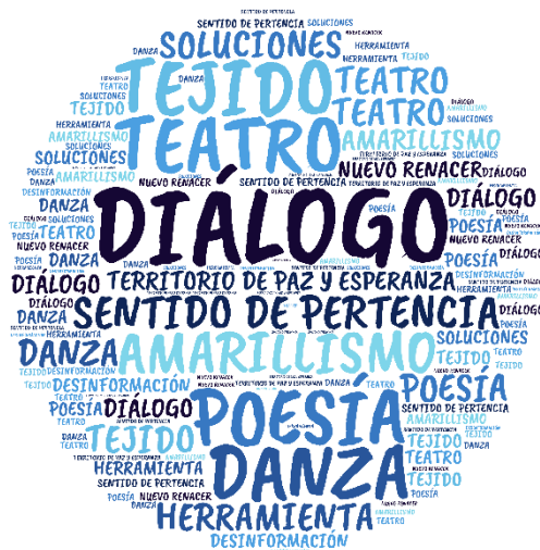
Figura 4. Nube de palabras categoría Discurso