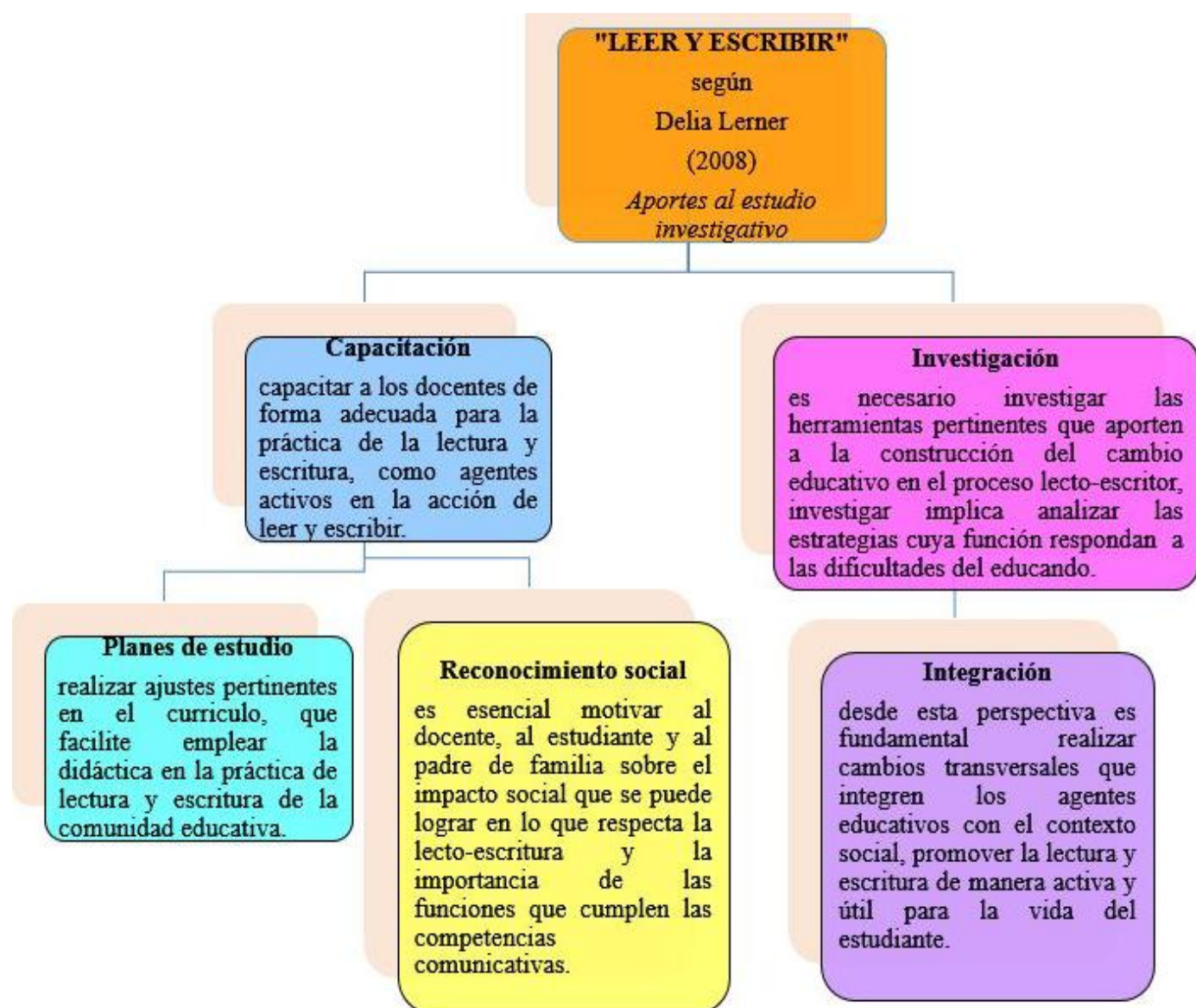
Figura 2: Aporte investigativo