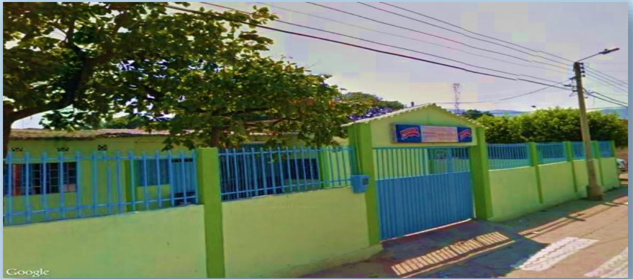
Figura 4: I.E Colegio once de noviembre del municipio de los patios.

Fuente: wikimapia, extraído pág. http://www.wikimapia.org (2014) Fecha: 17/03/17