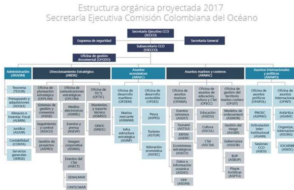
Figura 2. Organigrama organizacional informativo.

Se realizó un análisis del comportamiento organizacional que maneja el personal militar y civil por medio de la observación participativa y exploratoria, del cual se puede deducir, que ambos grupos son prudentes en el momento de solicitar cualquier información o realizar trato directo. Así mismo, resaltan la comunicación como un eje central entre la confianza y cooperación en el ambiente laboral.