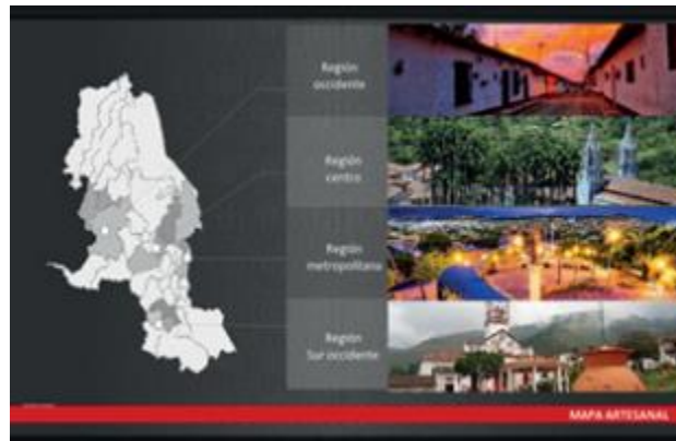
Figura 4 Principales regiones donde se extraen los materiales