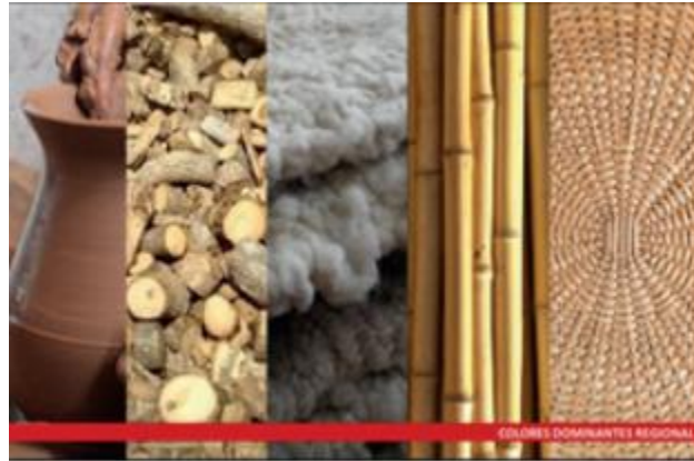
Figura 3 Clasificación materia prima utilizada para la elaboración de artesanías

se presenta la clasificación de la materia prima para la elaboración de artesanías y las principales regiones de donde extraen los materiales.