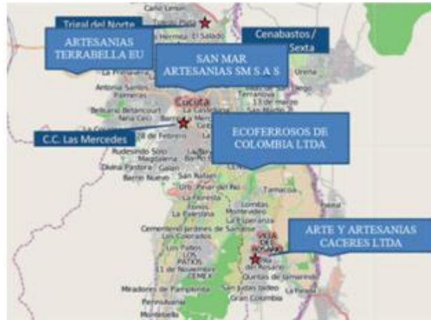
Figura 2 Mapeo de ubicación preliminar de principales de sitios de comercialización de artesanías

Como resultado del artículo de investigación deducimos que se procedió a realizar el mapeo de los lugares de comercialización de las piezas de artesanía para la posterior descripción contextualizada de las diferentes zonas (Figura 2).