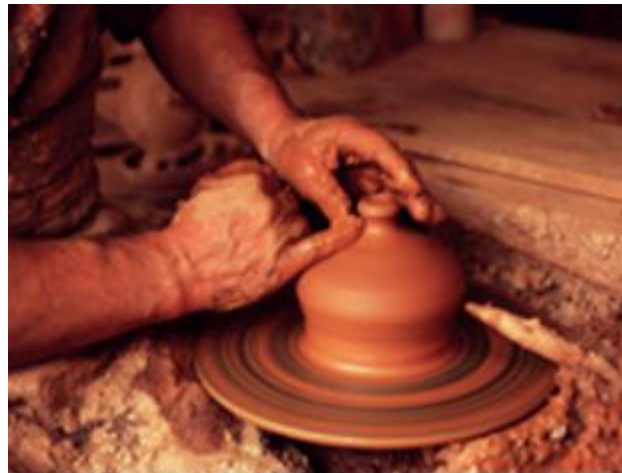
Figura 6 Artesanías en arcilla