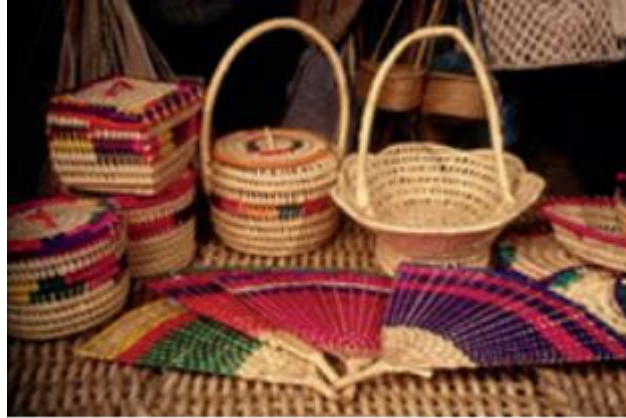
Figura 5 Artesanías en bejuco