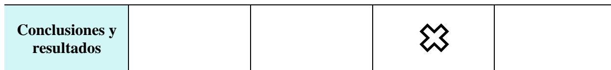
Tabla 1. Cronograma para la investigación, elaboración propia 2020