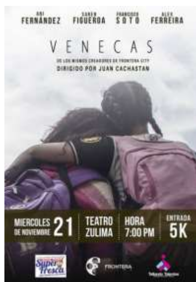
Fotografía 13- Poster Venecas.

“Atravesar la frontera puede constituir un riesgo, así como una amenaza de muerte, en especial en situaciones de migración indocumentada, desplazamiento forzado y tráfico de personas”. Mora, Luis. (S.F, p.12). Ante estas nociones de camino hacia las fronteras, es el cine juvenil que cuenta las historias, conecta las personas y construye unos lenguajes comprensibles entre naciones hermanas.