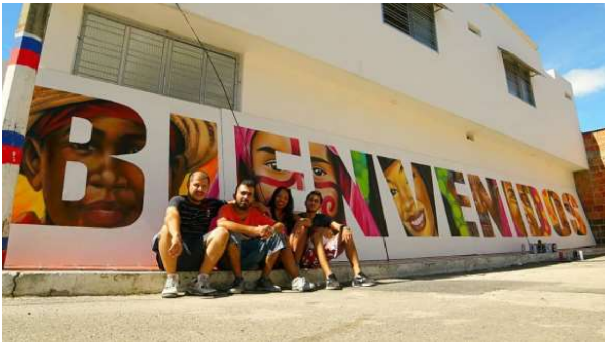
Fotografía 16- Grafiti día mundial del refugiado. Ubicado actualmente en el Puente Internacional Simón Bolívar. 2018.

Esta postura es respaldada por el semiólogo argentino Walter Mignolo, cuando menciona que: “El pensamiento fronterizo es la condición necesaria para pensar descolonialmente”. Mignolo (2015, p.181). Y es precisamente esta forma narrativa de contar la vida en frontera, la que impulsa la generación de unos nuevos saberes, construcciones propias y desde el sur.