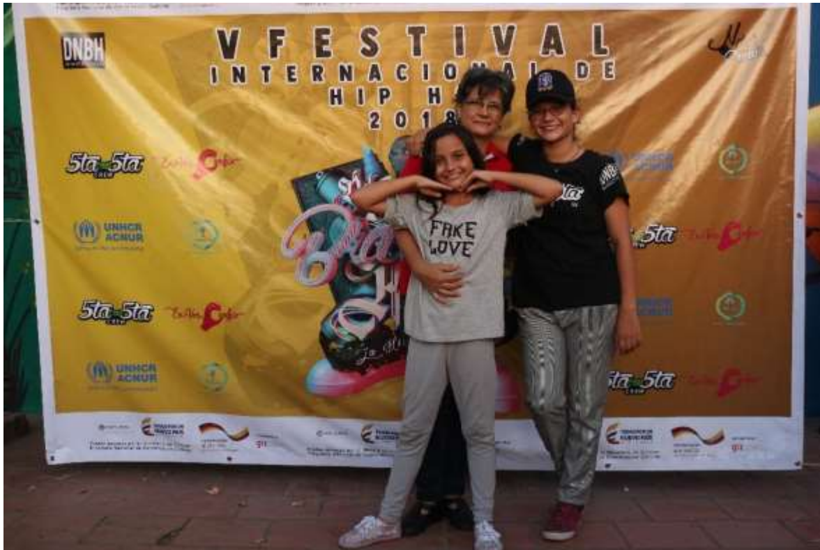
Fotografía 8- Los Patios Festival DNBH. Fotografía propia, 2018.

Valenzuela (2014, p.19) asegura que: “la resistencia cultural cuestiona de forma explícita los sentidos, valores y legitimidad de las otras culturas, con lo cual la resistencia asume rasgos de disputa y conflicto”. Si bien es cierto, la danza trabaja y asume las comunidades que han sufrido el conflicto, la respuesta de ésta, no es bélica o con intenciones de una respuesta con base en el odio. La respuesta es desde el arte y la memoria, precisamente buscando la no repetición y la construcción de ciudadanías consientes de ser generadoras de cambio, de no olvidar, producir verdad y nuevas percepciones de vida en la frontera, a través de la danza.