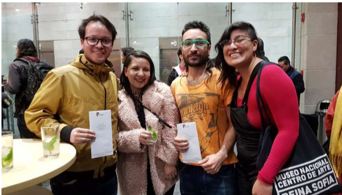
Fotografía 12- Premios Proimaganes.