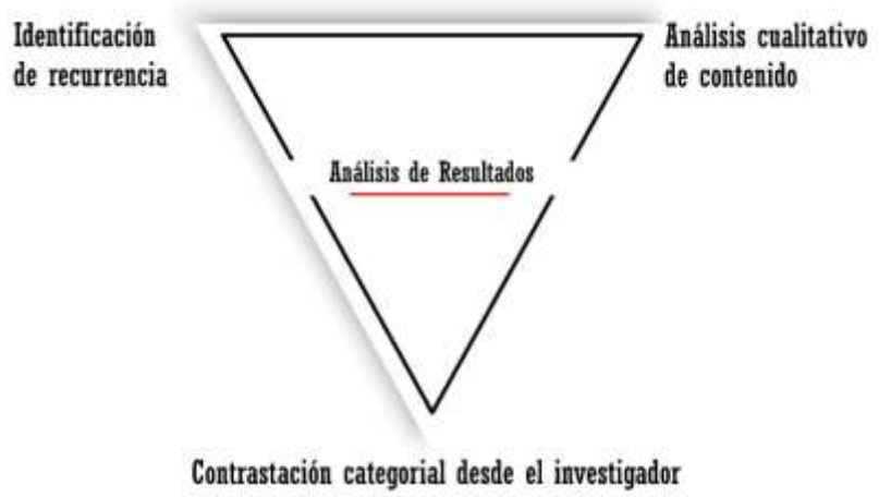
Ilustración 1- Triangulación de resultados-Elaboración propia, 2019

Al finalizar todas las entrevistas, pasarán por estos filtros de análisis categorial, y en este sentido, se encontrarán las categorías de recurrencia entre los artistas a partir de los cuestionarios. En consecuencia, se triangulará la información, para encontrar los resultados de la investigación. Se propone la siguiente ilustración donde se simboliza el proceso de conjugación de los datos.