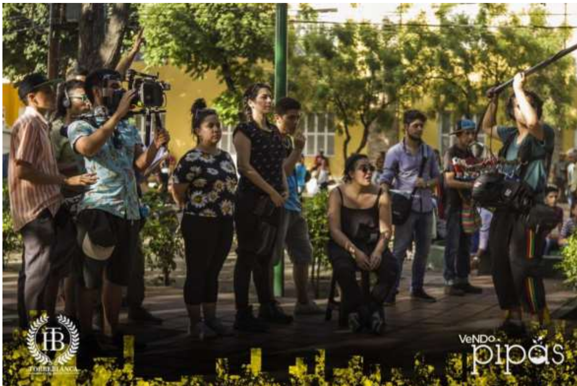
Fotografía 11- Corporación Frontera Films. 2018