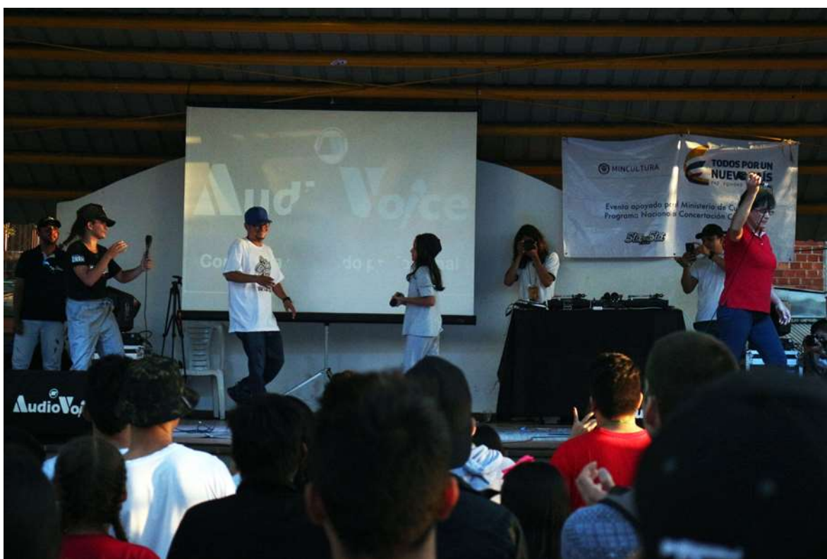
Fotografía 7- Los Patios Festival DNBH.

La Danza es un ejercicio artístico que permite movilizar el cuerpo a partir de una narrativa específica. El baile tiene un contexto, un significado, se baila para visibilizar algo, contar una anécdota, o recordar hechos que tienen una relación con el territorio. Salem (Fragmento 1 entrevista a Estefanía Orozco “Salem” 2019) afirma que: “La danza es entregar un pedazo del alma en cada movimiento, en los dedos, la cabeza, el cabello, los pies, todo. En una transmisión corporal de la libertad juvenil en la frontera”.