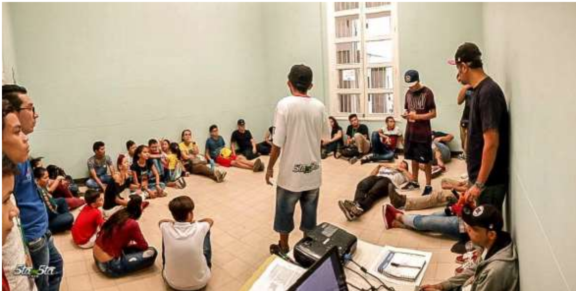
Fotografía 15- Taller de grafiti. Festival DNBH.

Esta percepción que desde Showy se propone, la construcción de los espacios para el grafiti, y éste mismo como un proceso educativo transversal, es la evidencia fáctica de como las instituciones educativas, no son el único lugar para aprender. Este pensamiento emancipatorio, postula modelos educativos descoloniales y formas artísticas de entender y generar la identidad con la ciudad y que además previenen la violencia.