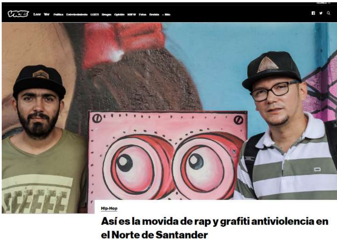
Fotografía 17- Nota VICE: https://www.vice.com/es_co/article/43q59g/rap-grafiti-antiviolencia-norte-de-santander-cucuta-ahiman-5ta-con-5ta-hip-hop . 2018.