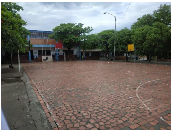
Ilustración 6. Cancha 1. Campos deportivos del colegio integrado fe y alegría.