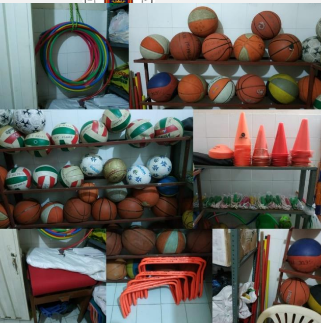
Ilustración 5. Elementos deportivos. Departamento de educación física del colegio integrado fe y alegría.