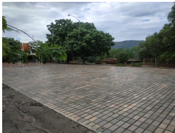
Ilustración 7. Cancha 2. Campos deportivos del colegio integrado fe y alegría.