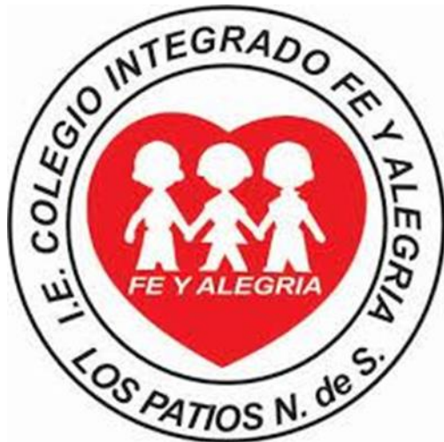
Ilustración 1. Colegio Integrado Fe Y Alegría. (2016). Escudo de la institución. Ilustración. Recuperado de http://www.enjambre.gov.co/enjambre/file/download/190309207