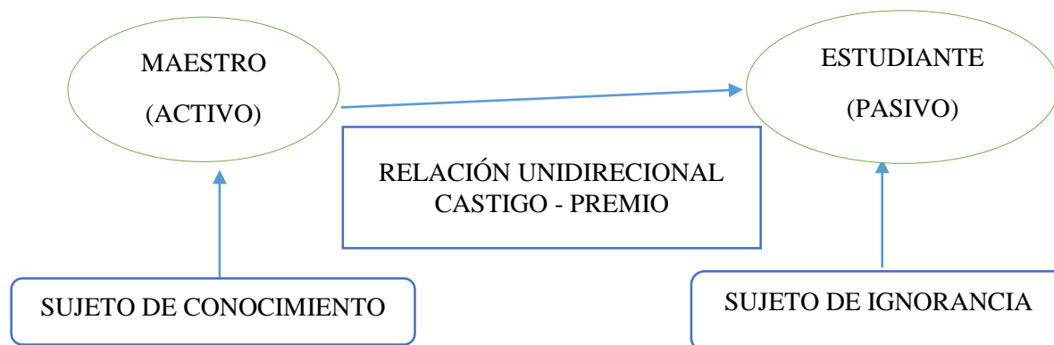
Ilustración 1: Relación maestro – alumno; (escuela tradicional)

En pocas palabras la relación entre el maestro – estudiante será representado en el siguiente esquema: