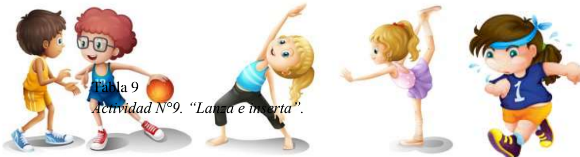
Tabla 9 Actividad N°9. "Lanza e inserta".