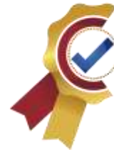
Figura 5. Planeación ejecutada.

ACREDITACIÓN INSTITUCIONAL Avanzamos... ¡Es nuestro objetivo!