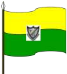
Figura 2. Bandera.

El color verde simboliza la frescura y el reflejo de nuestras montañas, la fertilidad de las tierras. Además, nos simboliza el descanso que para la tranquilidad y bien personal. El clima del municipio es siempre fresco y acogedor.