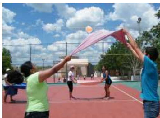
Tabla 2 Actividad N°2. “Hockey ball”.