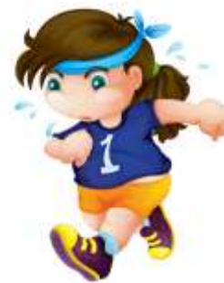
Tabla 8 Actividad N°8. “Sucribol”.