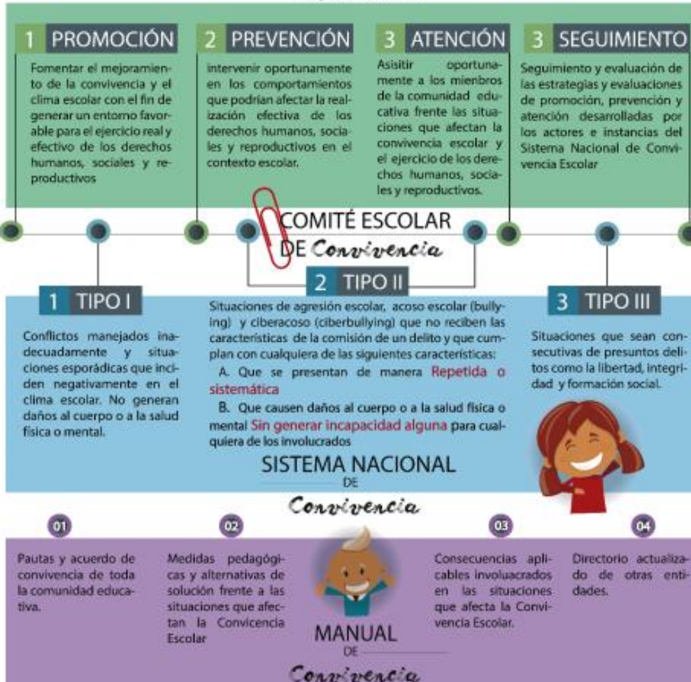
Figura 3. Marco Legal. (Manual de Convivencia Carlos Pérez Escalante)