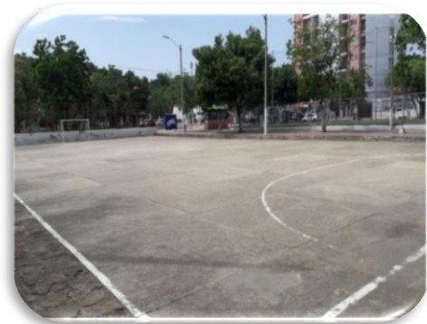
Figura 10. Polideportivo de Baloncesto (Fotografía) Figura 11. Polideportivo de micro fútbol (Fotografía)