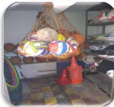
Figura 13. Elementos deportivos (Fotografía)