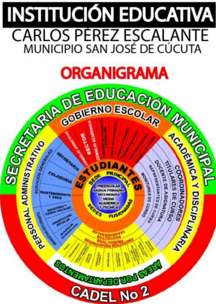
Figura 4. Organigrama Institucional. (Manual de Convivencia Carlos Pérez Escalante).