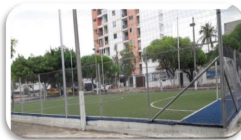
Figura 12. Polideportivo de micro fútbol gramillado (Fotografía)