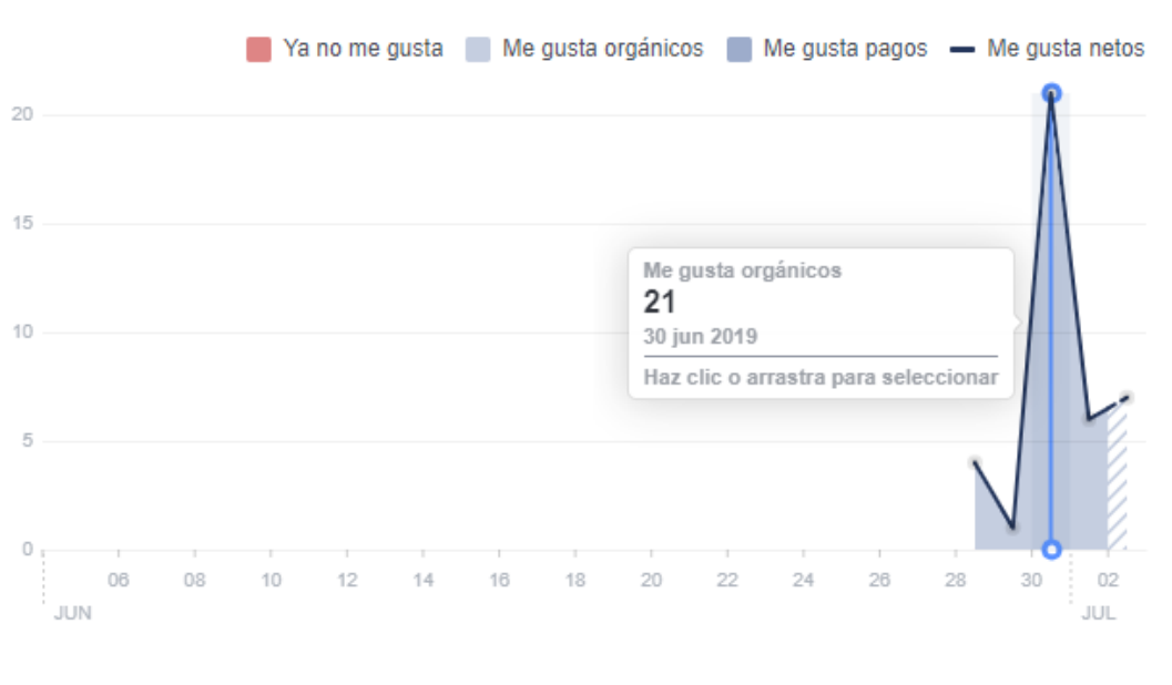
Fig.3 Total de Me Gusta orgánicos