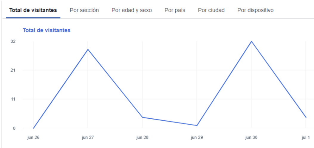
Fig. 2 Balance de Visitas