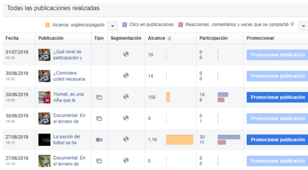
Fig. 1 Estadística General

Se creó un Fanpage, como método estratégico para promocionar el producto audiovisual. Estos fueron los resultados: