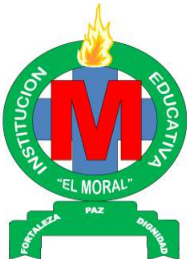
Ilustración 1 (Escudo)

SIGNIFICADO: El escudo este hecho en forma de círculo donde identifica a los estudiantes como una gran familia, un conjunto de personas unidas por ideales comunes, metas grandes y que el fin de todo proceso educativo es la conquista de sí mismo, de su propio mundo, para así ser capaces de transformar su entorno, construir el futuro y avanzar por la vida seguro de formar su propio destino.