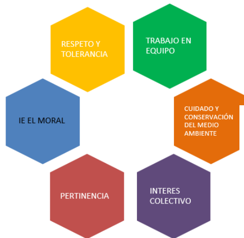
Figura No.1 Principios Institucionales

Por consiguiente, la institución busca que el estudiante llegue a ser persona responsable en armonía con la sociedad, que obre libremente, que sea reflexivo, tolerante, comprensivo aplicando la axiología humana, gracias al esfuerzo constante, consiente y responsable.