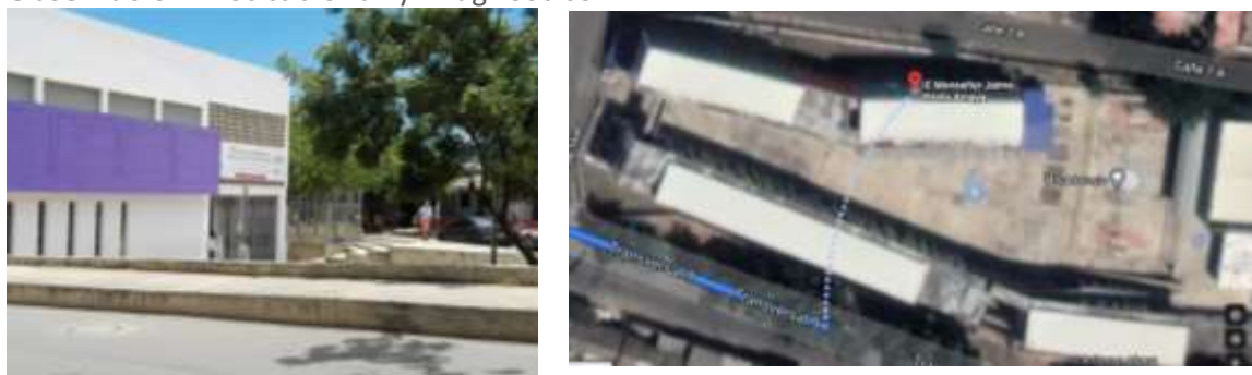
Figura 1. Ubicación I.E monseñor Jaime Pietro Amaya: Google Maps, 2021

UBICACIÓN DE LA CANCHA: Se encuentra en toda la parte interior de la institución, Como se puede observar en la imagen.