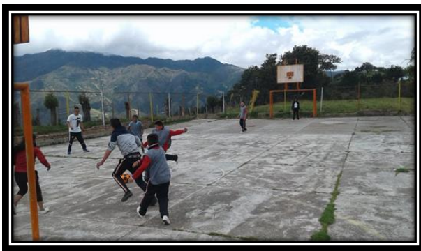
Autor: Wilmer Álvarez (2019)