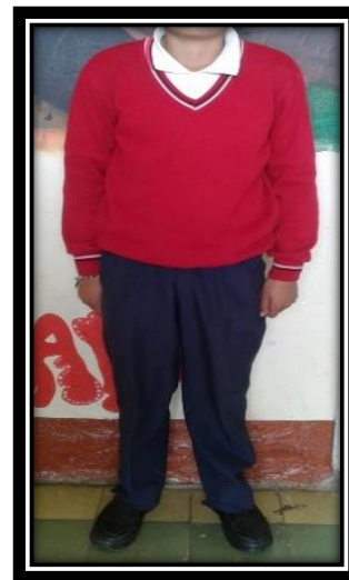
UNIFORME DE DIARIO NIÑO