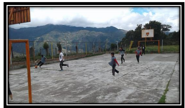
Autor: Wilmer Álvarez (2019)