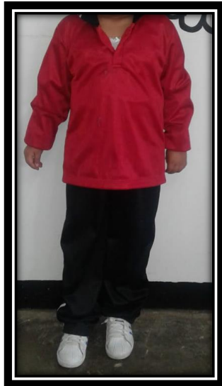
UNIFORME DE EDUCACION FISICA