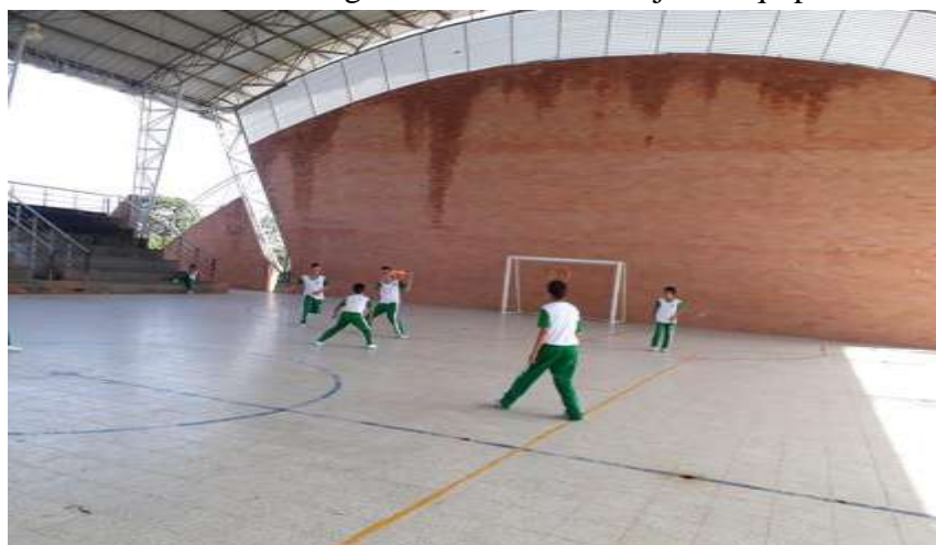
Foto 25. Dribling de baloncesto- trabajo en equipo.