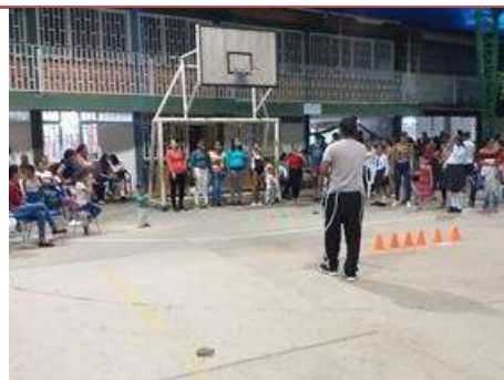
Día de las madres