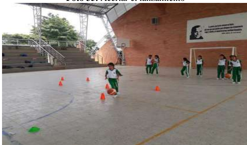
Foto 35. Acertar el lanzamiento

Variante: deberán ir en parejas sujetados de las manos y lanzar un aro por turno.