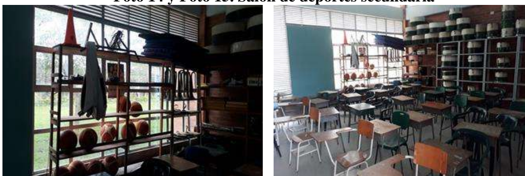
Foto 14 y Foto 15. Salón de deportes secundaria

El salon de deportes de secundaria cuenta con sus respectivos pupitres en buen estado para impartir clases teoricas, no cuenta con tablero. En el se encuentran once (11) balones de baloncesto, dos conos y siete (7) colchonetas.