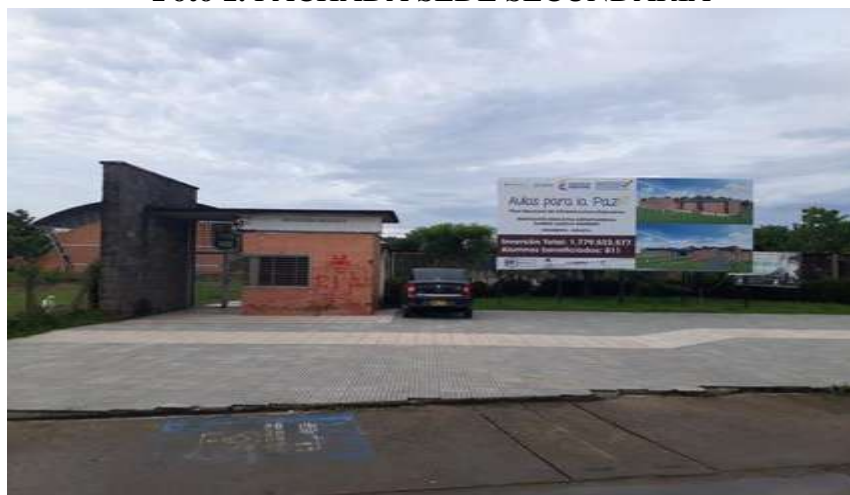
Foto 1. FACHADA SEDE SECUNDARIA