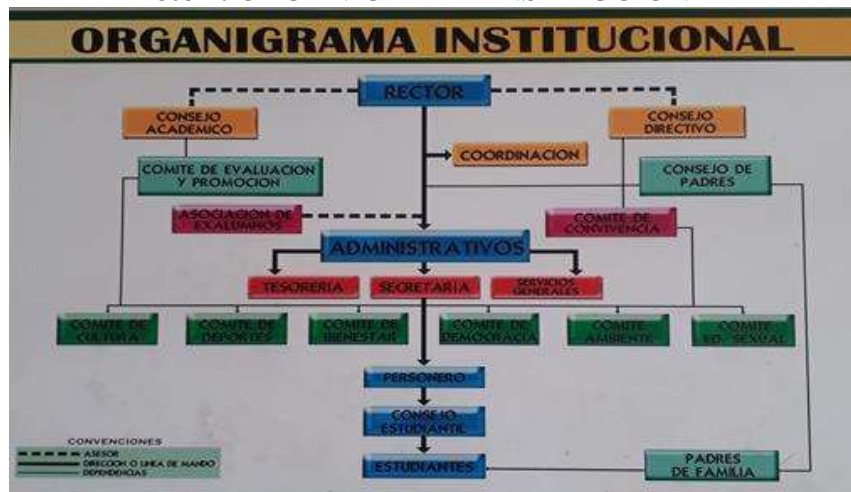
Foto 2. ORGANIGRAMA INSTITUCIONAL

Fuente: Institución educativa Gabriel García Márquez, 2019