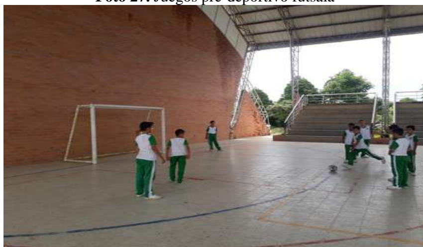
Foto 27. Juegos pre-deportivo futsala