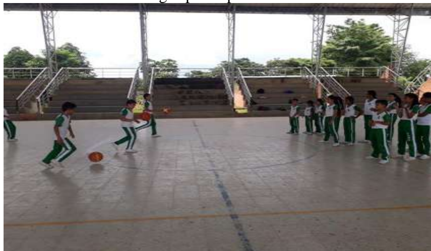
Foto 28. Juegos pre-deportivos. Baloncesto

Variante: el estudiante que tiene el balón debe pasar detrás de sus compañeros pasarlos haciendo eslabon y seguir corriendo a lanzar el balón a su compañero de al frente.