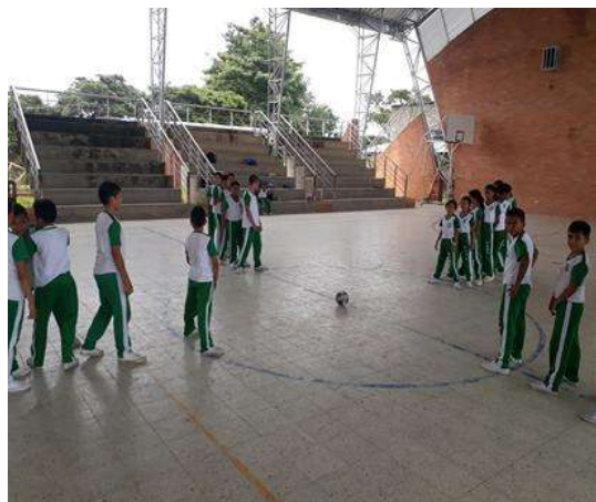
Foto 18. Quien toque primero el balón

Variante: Los estudiantes no pasaran por debajo de las piernas de sus compañeros gateando, tendrán que pasar haciendo zigzag por en medio de sus compañeros. Los estudiantes ya no saldrán corriendo hacia la derecha si no hacia la izquierda.