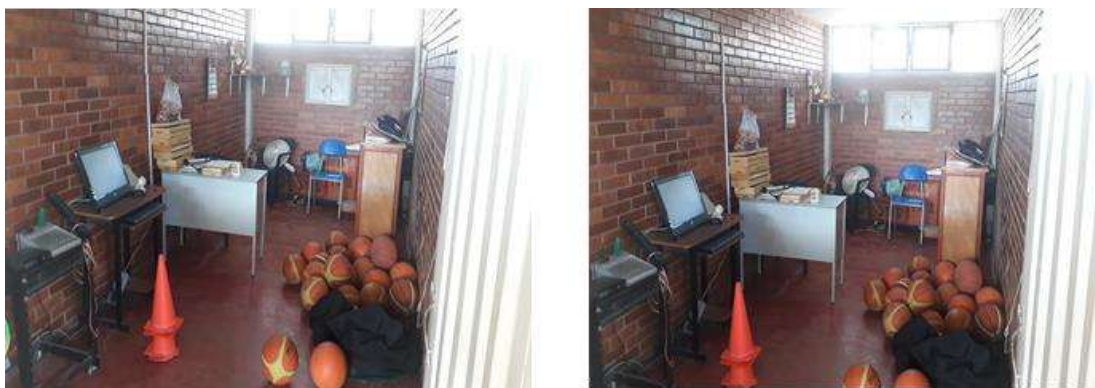
Foto 16 y Foto 17. Salón de deportes primaria

El salon de deportes de la basica primaria no cuenta con pupitres para impartir clases teoricas. En el se encuantran veinte (20) balones de baloncesto, un (1) balon de futbol sala en mal estado, dos (2) aros, siete (7) tableros de ajedrez y doce (12) conos.