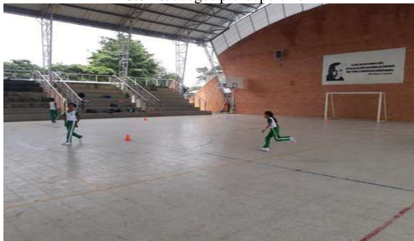
Foto 26. Juegos pre-deportivo