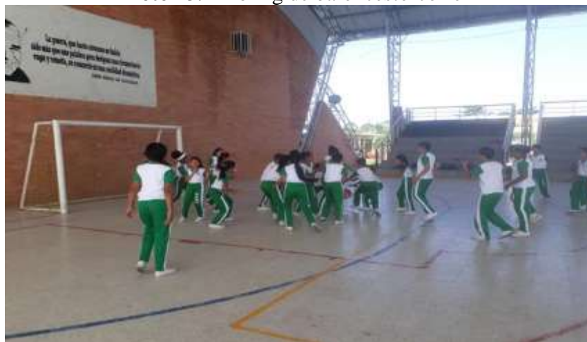
Foto 23. Dribling de baloncesto-correr