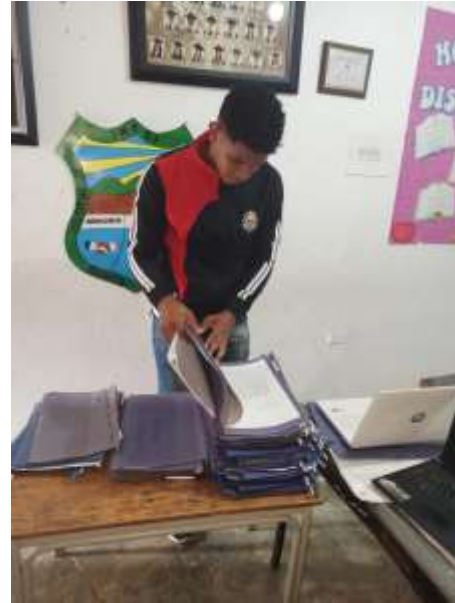
Imágenes de realización del disco por parte de una estudiante del grado séptimo