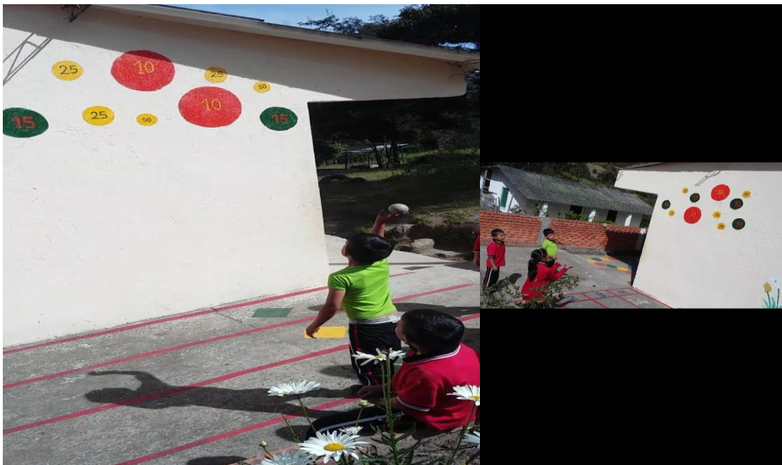
En esta se refuerza la habilidad de lanzar y atrapar que es fundamental como habilidad motriz básica.