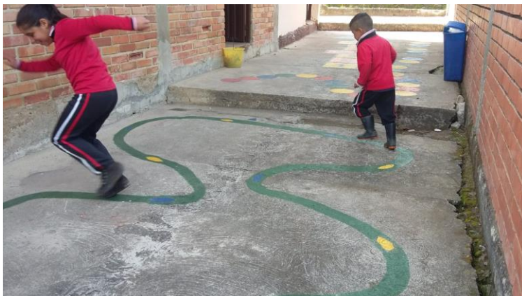
En esta estación se refuerza por medio de esta serpiente pintada la habilidad del equilibrio.